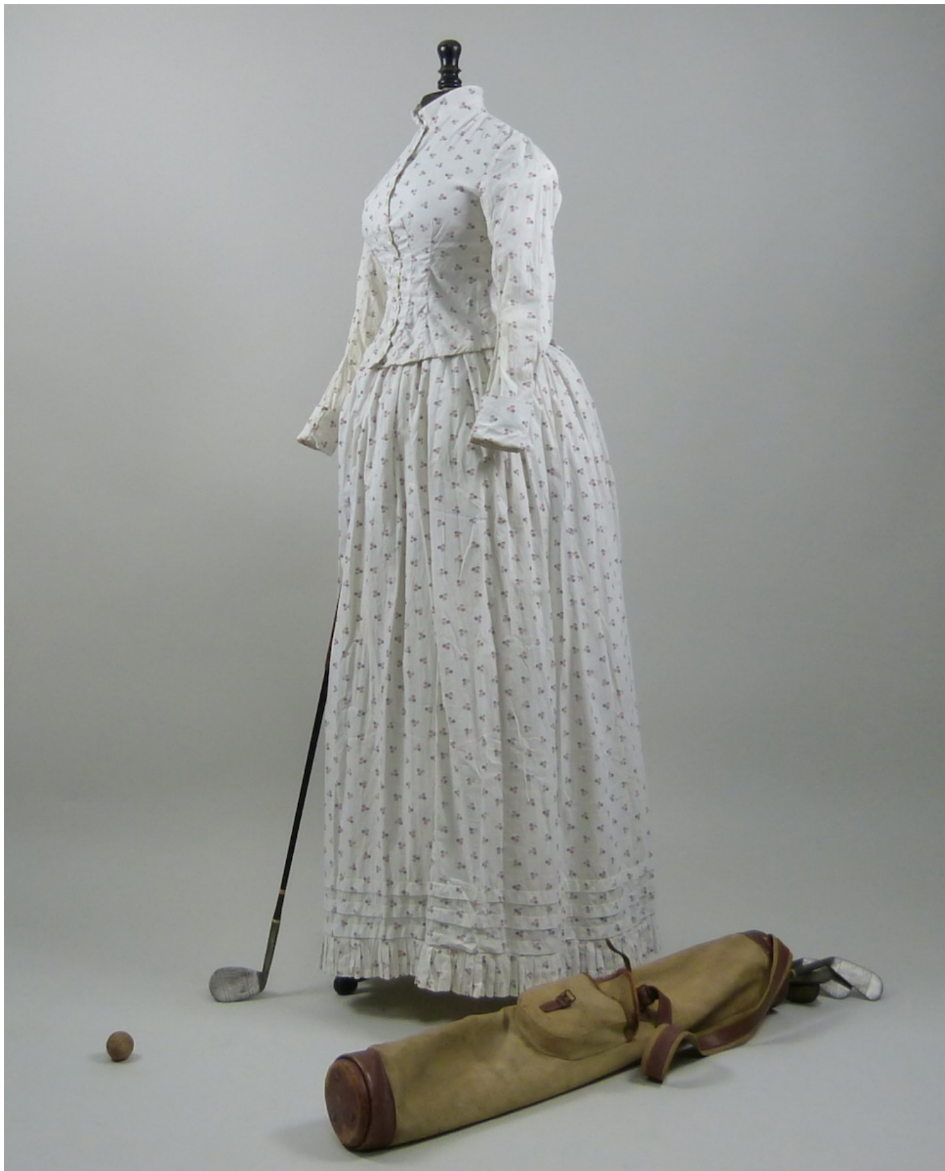
Экипировка для гольфа с сумкой, мячом и клюшкой, 1880 год

В межвоенное время спорт становится все более профессиональным, а спортсмены начинают занимать высокое социальное положение – одежду для них с удовольствием шьют известные кутюрье. Так, в 1919 году, задолго до того, как Роджер Федерер стал лицом Uniqlo, французская теннисистка и чемпионка Сюзанн Ленглен вышла на корт в коротком (слишком коротком для того времени) плиссированном платье от Жана Пату. Теннису мы обязаны и появлением рубашки-