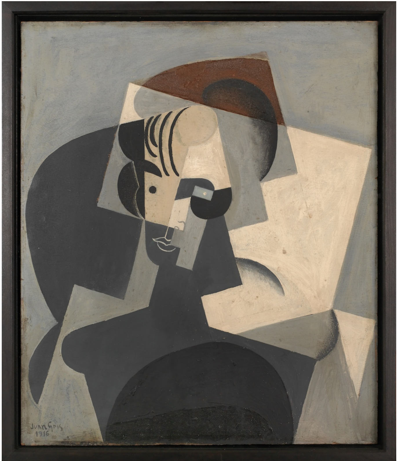
Хуан Грис. Портрет жены художника (Жозетта Грис), 1916. Hermann und Margrit Rumpf-Stiftung, Kunstmuseum Bern

От редакции: Еще больше интересных выставок и анонсов мероприятий вы найдете в нашей Афише .