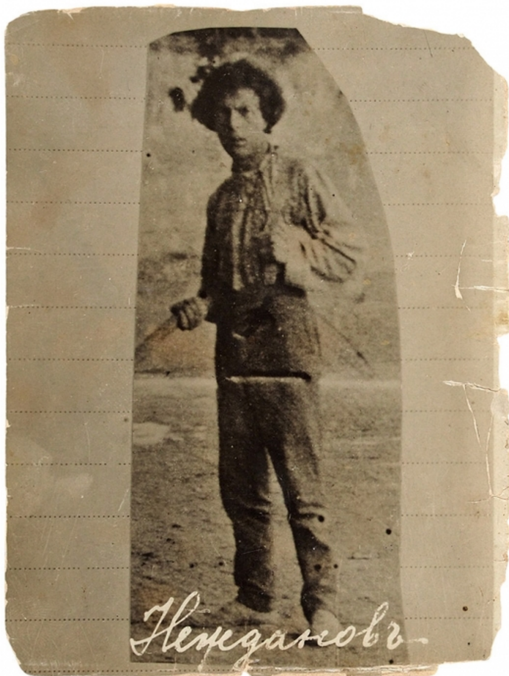
Андрей Соболев. Фотография 1911 года из Охранного отделения + Публикация А. Соболева в журнале «Рупор», вып. 3. М., 1922.

Литературное наследие писателя, почти на век исчезнувшего за спинами своих более известных современников, достаточно велико. В 1926 году вышло четырёхтомное собрание его сочинений, в 1928-м – трёхтомник. В основном он писал рассказы, но были и более крупные произведения: роман «Пыль» 1915 года, повесть «Салон-вагон» 1922-го. С конца 1920-х годов произведения Соболева не переиздавались, будучи признаны упадническими. Только в годы перестройки несколько его рассказов появились в «Огоньке», а в 2001 году в московском издательстве «Книгописная палата» вышел 320-страничный сборник под подходящим названием «Человек за бортом», в который был включен и «Паноптикум», теперь впервые переведенный на французский язык бельгийкой Фаншон Делинь.