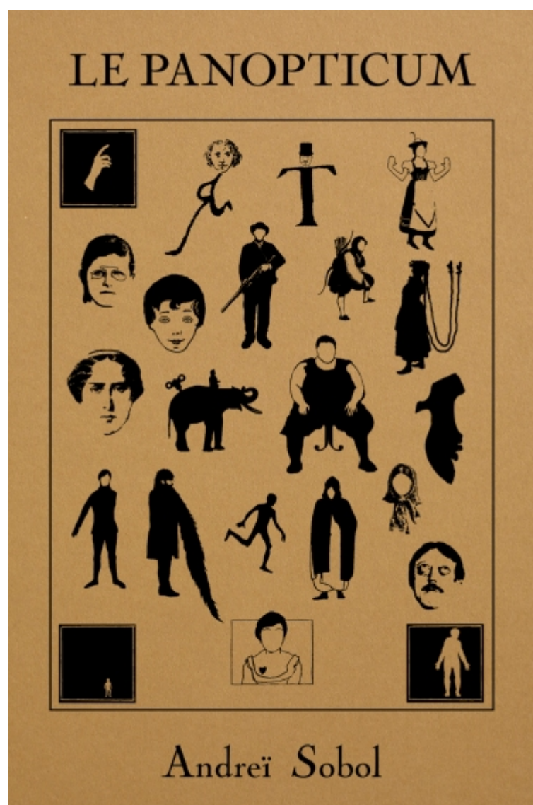
Обложка французского издания "Паноптикума"