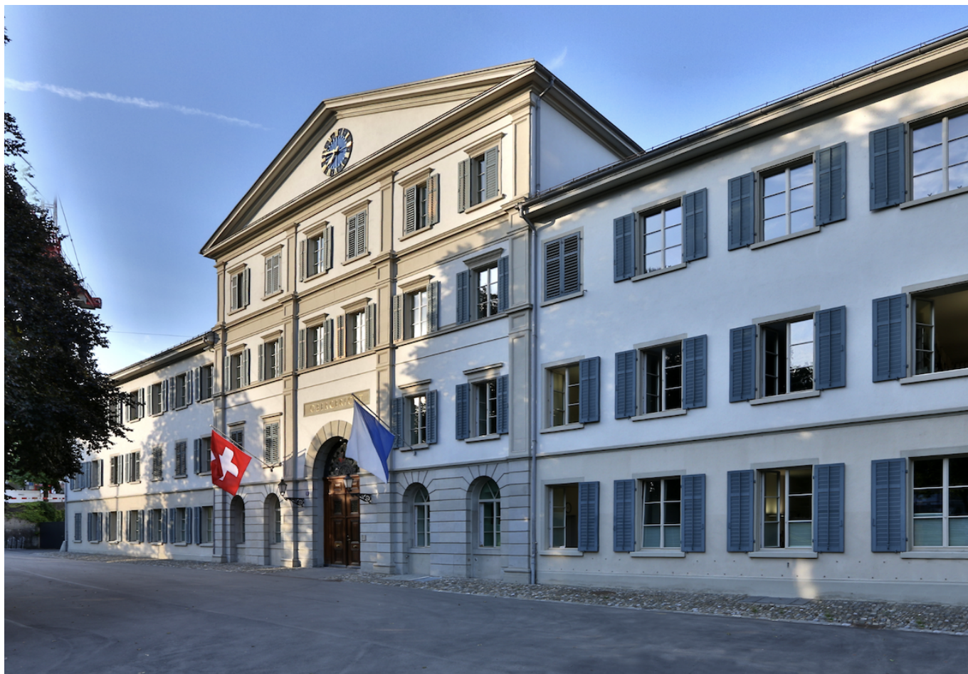
Здание Высшего суда Цюриха.

Auteur: Зарина Салимова, Берн , 11.11.2024.