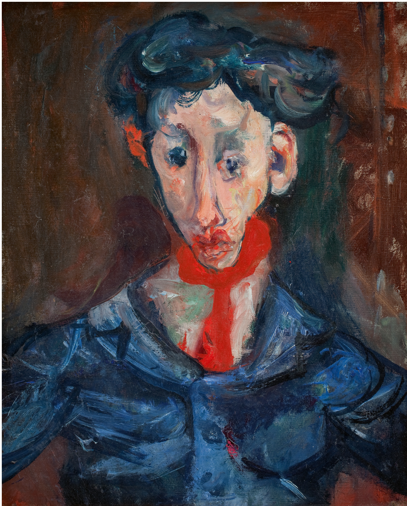
Хаим Сутин. Цыган, 1926. Statens Museum for Kunst, Copenhagen

В искусстве Сутин искал собственный путь, оставаясь застенчивым аутсайдером и буквально плывя против течения. В то время как многие его современники сосредоточились на абстракции, Сутин продолжал писать фигуративно, всегда отталкиваясь от реального объекта.