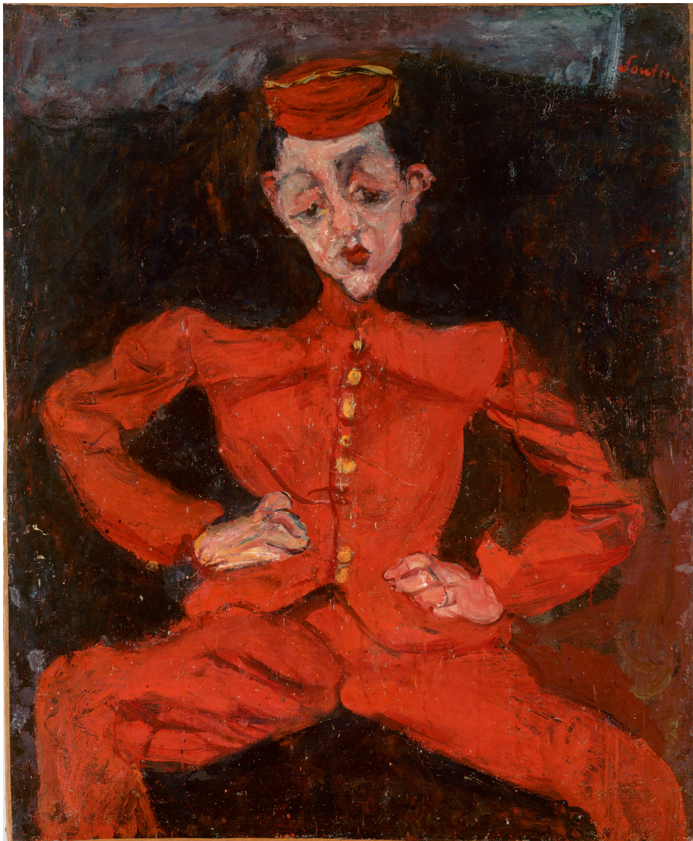
Хаим Сутин. Посыльный, 1925. Centre Pompidou, Paris, Musée national d'art moderne – Centre de création industrielle

Выставка завершается поздними работами художника – портретами конца 1920-х и 1930-х годов. Можно заметить, что линии на картинах стали более сдержанными, а на лицах теперь преобладает выражение покоя и даже некоторой мечтательности. Зайдя в этот зал, любой белорус сразу скажет, какого портрета здесь не хватает. Конечно, «Евы», написанной в 1928 году, находящейся в корпоративной коллекции «Белгазпромбанка» с 2013-го и превратившейся в один из главных символов мирных