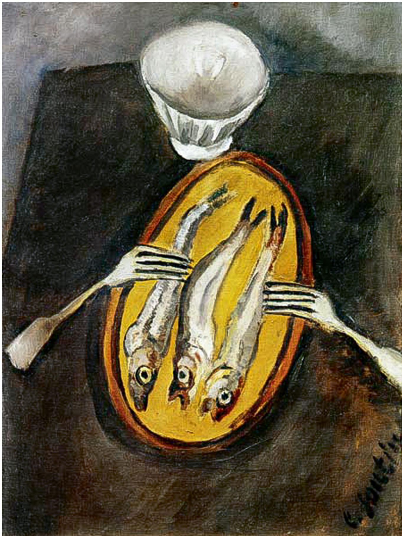
Хаим Сутин. Натюрморт с селедкой, 1916. Galerie Larock-Granoff, Paris.

Эта тревога усиливается в следующем зале, «мясницкой», где вывешены знаменитые туши Сутина – мертвые животные, отправленные на убой. Еще не разделанные, но