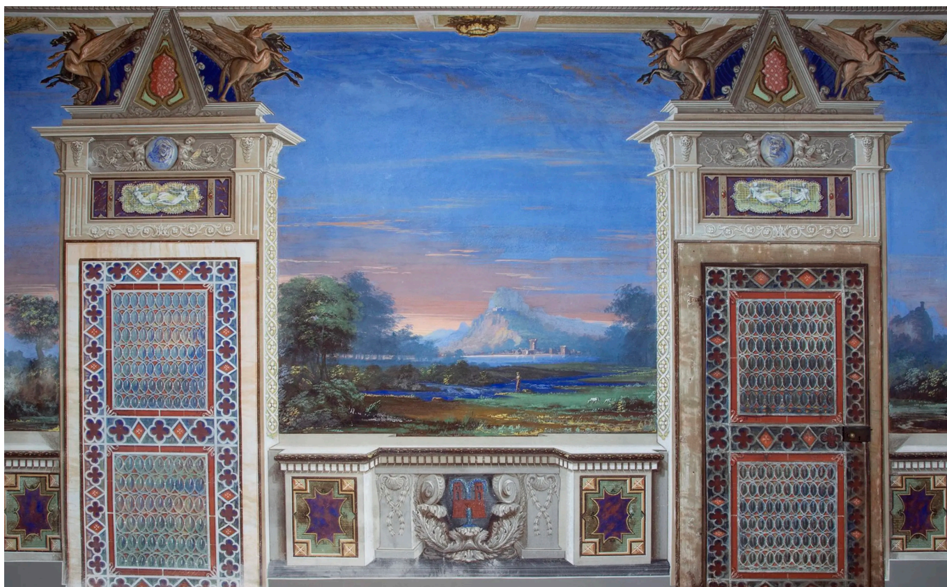
Ронко-сопра-Анкона