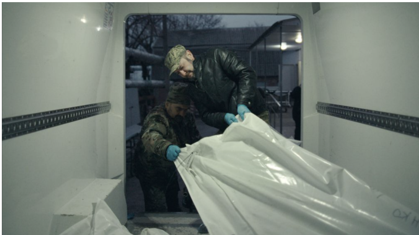
Кадр из фильма «Dear Beautiful Beloved»