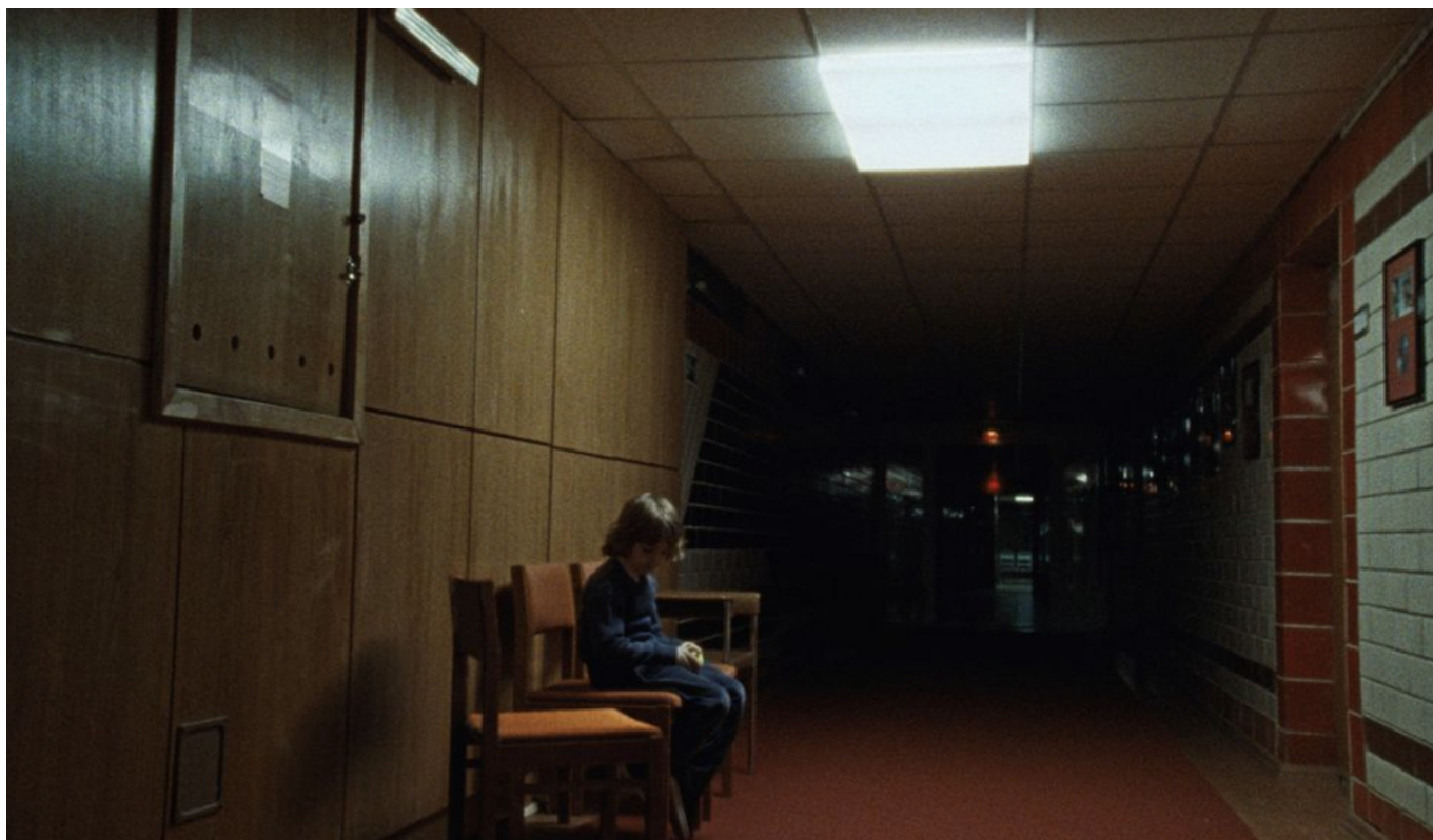
Кадр из фильма «Гимн чуме»