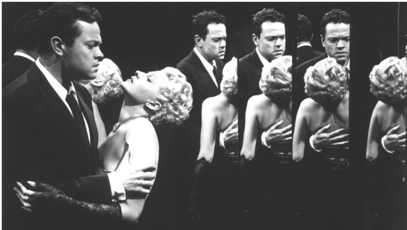
Кадр из фильма «Леди из Шанхая»

Кто получит «Золотого леопарда», пока неизвестно, но зато уже известны имена лауреатов специальных наград. Икона Болливуда Шахрух Хан получит приз за творческие достижения Pardo alla Carriera. За последние тридцать лет индийский актер снялся более чем в ста фильмах – мюзиклах, криминальных картинах и исторических драмах. Один из главных фильмов в его карьере, «Девдас», будет показан в Локарно 11 августа в присутствии самого актера. Приз за выдающиеся достижения достанется Гийому Кане и Мелани Лоран, сыгравшим главные роли во французской исторической драме о последних днях Людовика XVI и Марии-Антуанетты «Потоп» (Le déluge). Фильм будет показан на Пьяцца Гранде в вечер открытия. Почетной награды Pardo d'Onore будет удостоена режиссер Джейн Кэмпбелл, ставшая первой женщиной, получившей Золотую пальмовую ветвь в Каннах в 1993 году за фильм «Пианино», и первой женщиной, дважды номинированной на премию «Оскар» в категории «Лучший режиссер». Награда Leopard Club Award будет вручена актрисе Ирен Жакоб, международную известность и признание которой принесли работы в фильмах польского режиссера Кшиштофа Кесьлевского «Двойная жизнь Вероники» и «Три цвета: красный». А премию «За жизненные достижения», которую кинофестиваль в Локарно вручает выдающимся деятелям кино, в этом году получит пятикратный лауреат премии «Оскар» мексиканский режиссер Альфонсо Куарон.