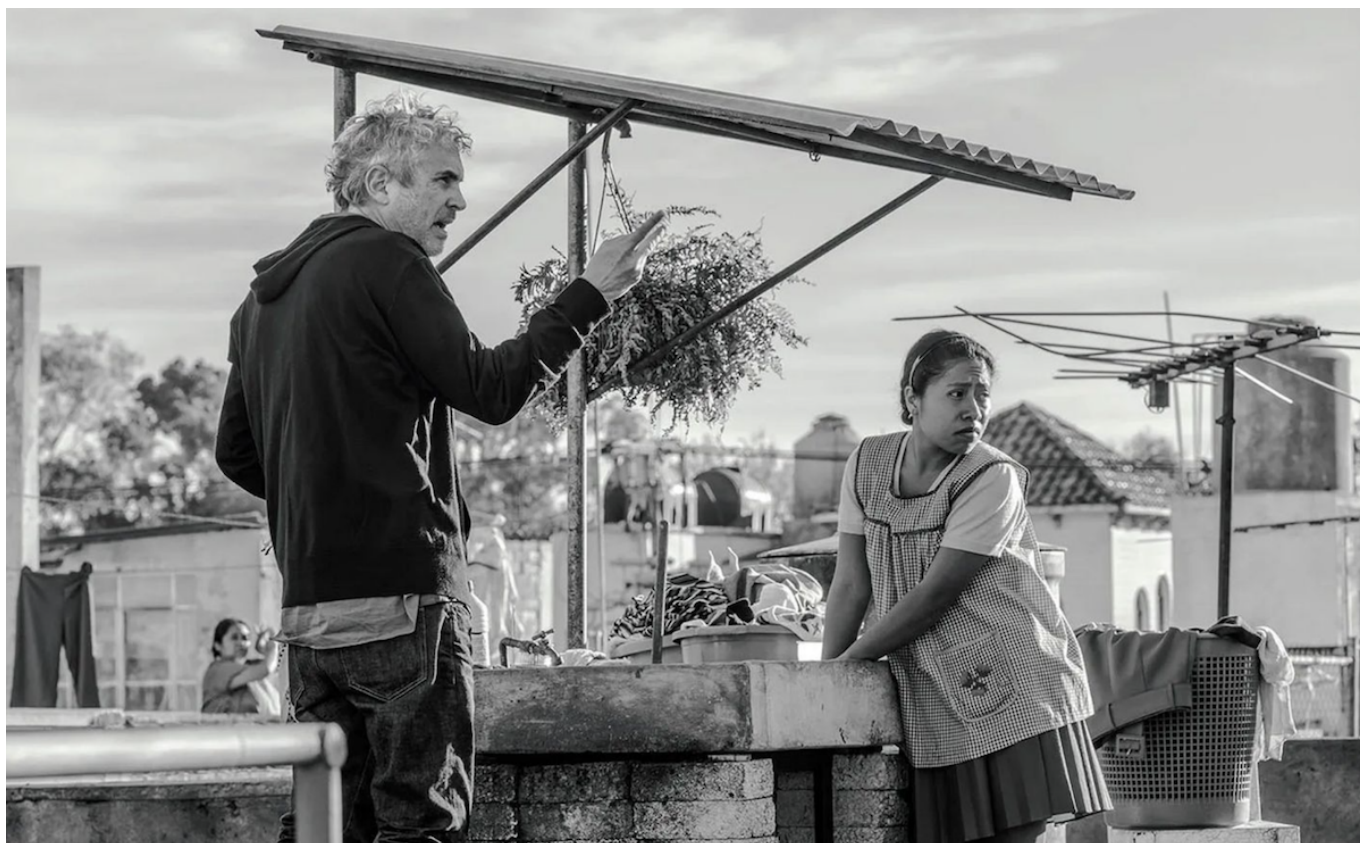
Альфонсо Куарон

От редакции: с полной программой фестиваля можно ознакомиться на сайте locarnofestival.ch . Приятных вам кинематографических открытий!