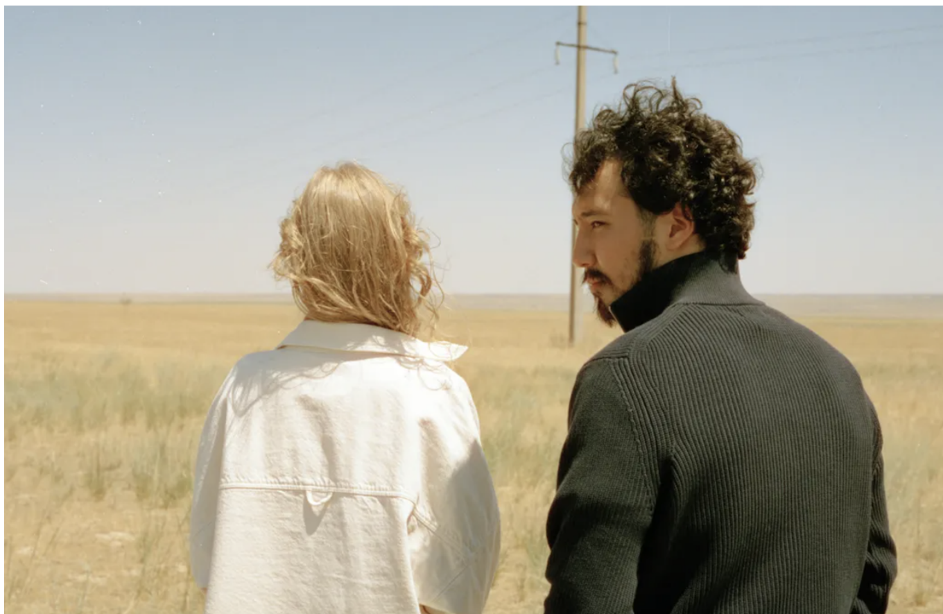
Кадр из фильма «Joqtau»