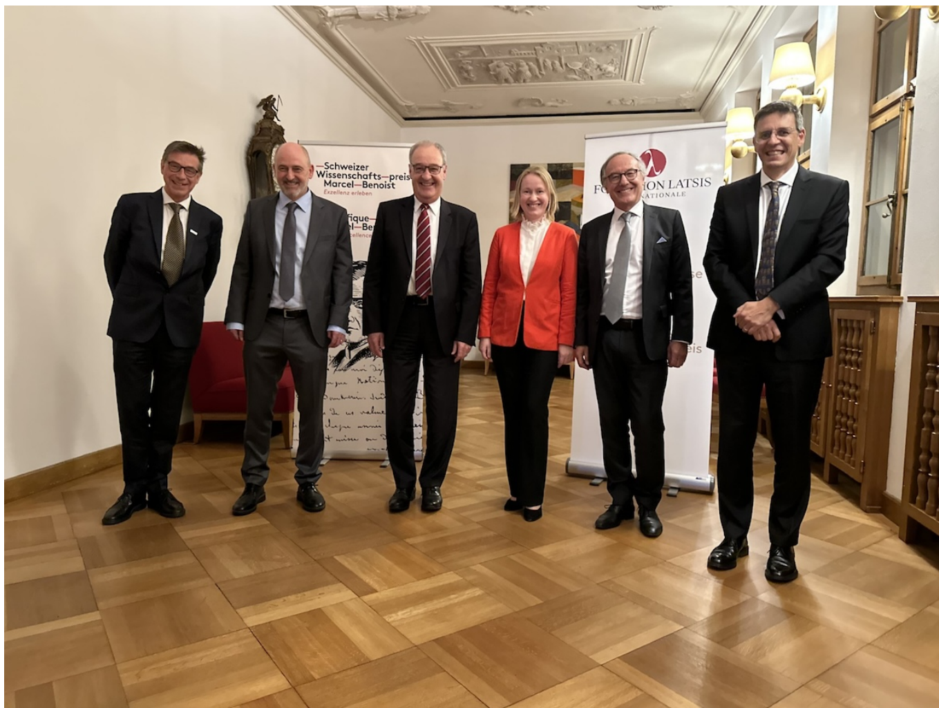
Леся Щуцкая на торжественной церемонии вручения премии Лациса. 30 октября 2023 года, Берн. Слева от Леси - министр экономики, образования и науки Ги Пармелен.

Я задам сложный вопрос. Вы - украинка, но учились в Москве, и у Вас наверняка осталось много контактов с российскими коллегами. Как идущая в Украине война отразилась на исследованиях и научном сообществе?