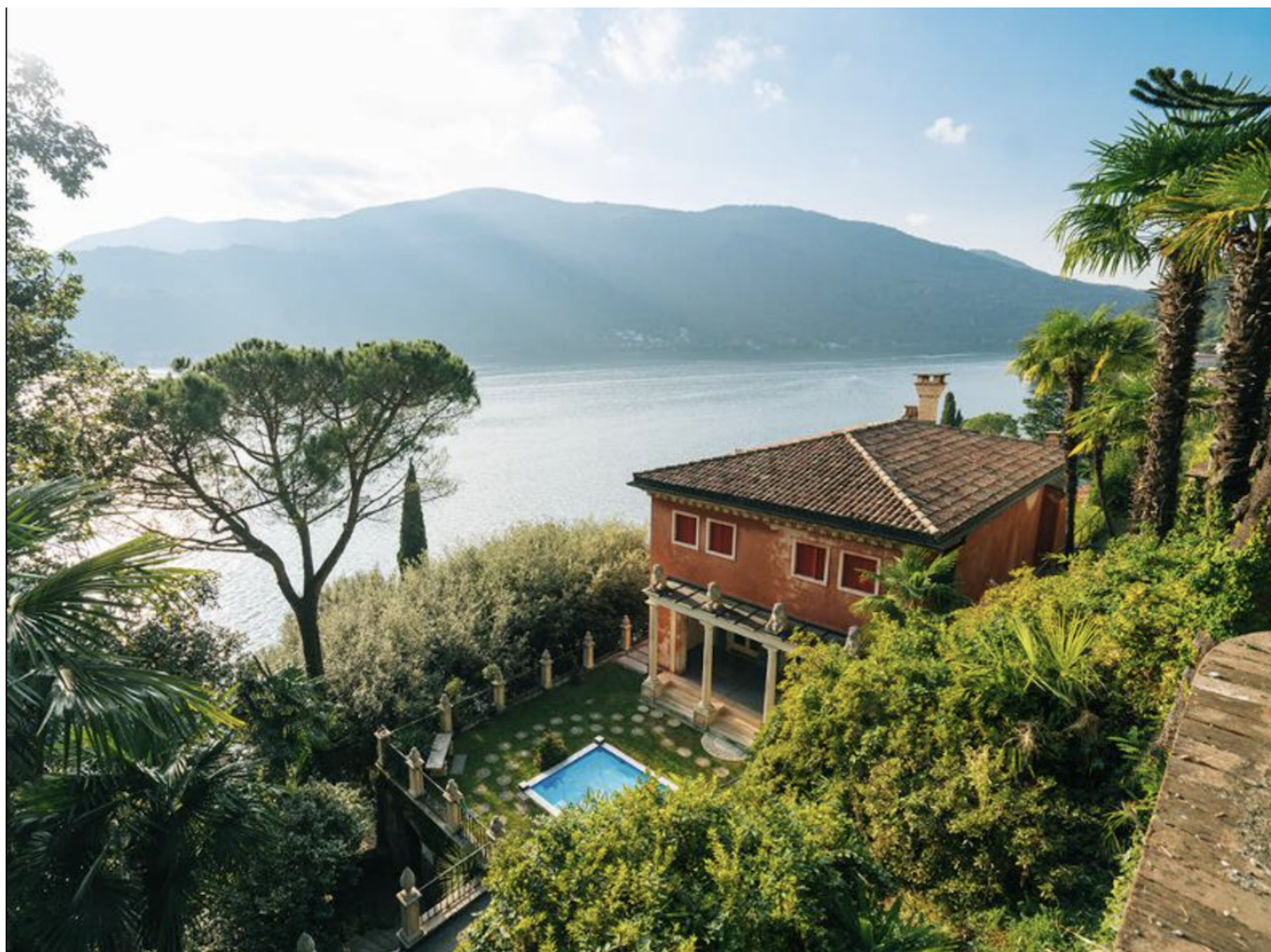
Парк Шерпера в Моркоте.

средиземноморский стиль, в другой – азиатский. Средиземноморский сад в стилях барокко и ренессанс украшен множеством статуй. Засаженная бамбуком дорожка ведет в восточную часть сада, который удивляет сиамскими, арабскими и индийскими постройками и типичной для этих регионов флорой. Сегодня парк поддерживается в том виде, в каком он был изначально заложен семьей Шерпер.