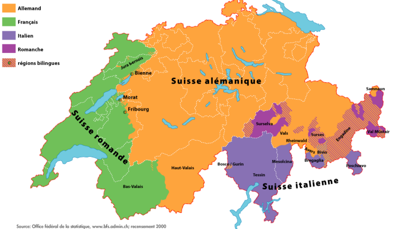
Répartition géographique des langues officielles en Suisse (2000)

Auteur: Надежда Сикорская, Цюрих , 02.10.2023.