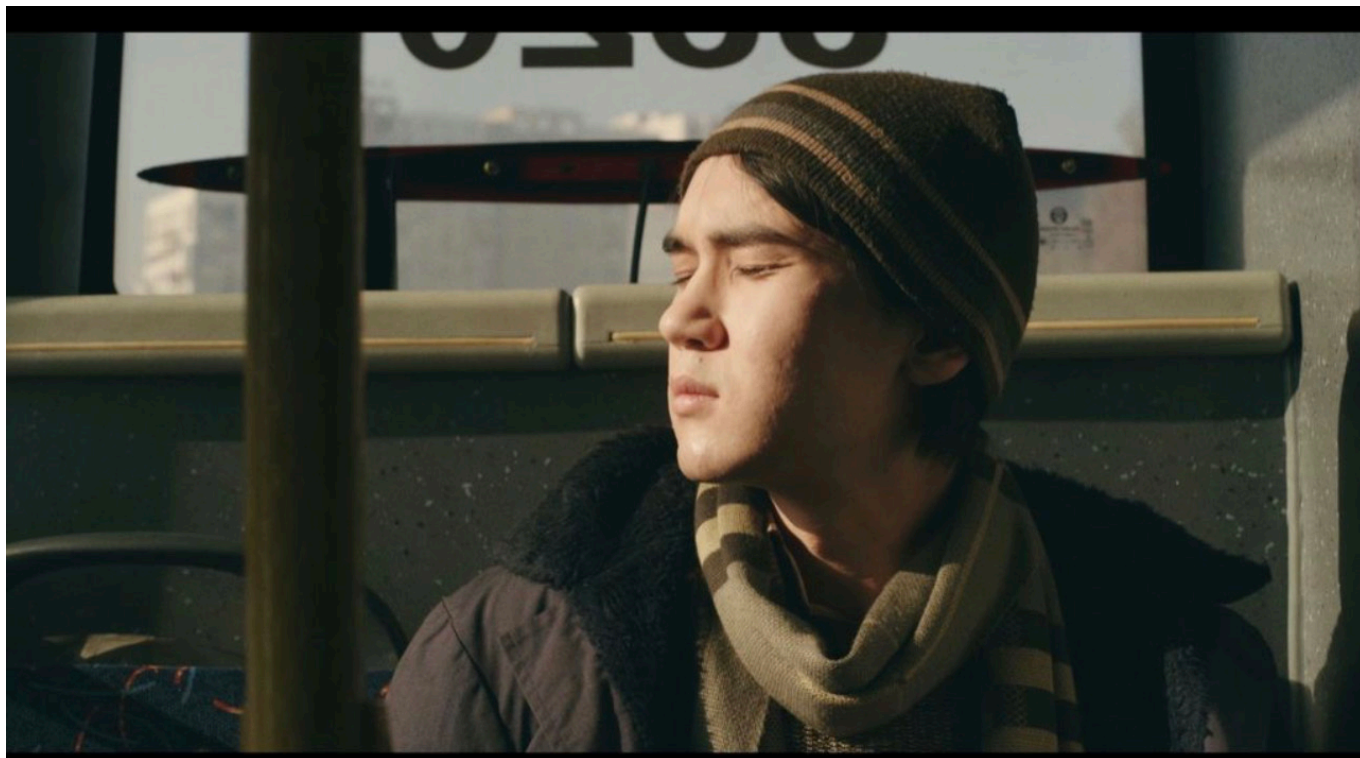
Кадр из фильма "Последний сеанс"

Состоится в Локарно и мировая премьера фильма любимца мировых кинофестивалей, самого раскрученного режиссера Казахстана Дарезжана Омирбаева. Дебютная картина «Кайрат» уже принесла ему «Серебряного леопарда» в Локарно в 1992 году, следующая работа, «Кардиограмма», была отобрана в официальный конкурс Венецианского кинофестиваля. А самый его известный в России фильм «Киллер» одержал победу в каннской программе «Особый взгляд». Фильмы Омирбаева регулярно выходят в прокат во Франции, кинокритики называют его последователем Робера Брессона. Говорят, сам Жан-Люк Годар знает и любит его творчество! Новый 30-минутный фильм называется «Последний сеанс». Он снят на казахском и русском языках и участвует в конкурсе «Режиссеры будущего» (Pardi di domain). Вот что говорят о фильме его авторы: «Наш фильм – о непростой судьбе художника, который должен быть готов нести тяжесть одиночества. Это страшная, но прекрасная судьба, от которой никто не может убежать. То, что всегда было, и всегда будет».