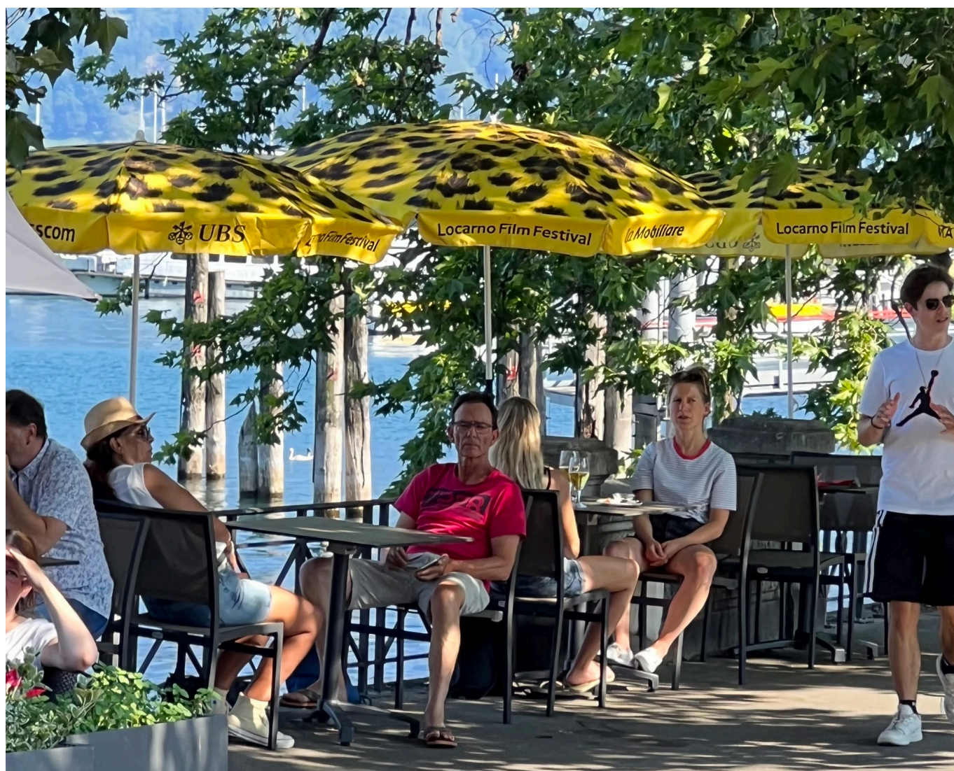
Жители Локарно к фестивалю готовы © Nana Gobeshia

Auteur: Нана Гобешия, Локарно , 29.07.2022.