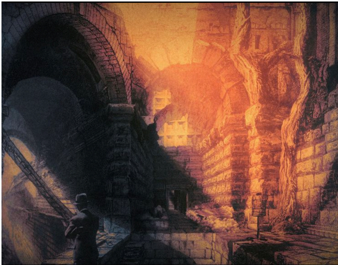
Кадр из фильма "Сказка"

Картина представляет собой фантастическую историю о событиях Второй мировой войны. Это гражданское и художественное высказывание о тех, кто определил судьбу планеты: Сталин, Черчилль, Муссолини, Гитлер. «Сказка» снималась в сотрудничестве с Бельгией, без государственного российского финансирования. Фильм технологически сложный, снят в цвете и без, основан на архивных киноматериалах. В нем звучат грузинский, немецкий, итальянский, французский и английский языки и заняты исключительно зарубежные артисты. По имеющейся информации, Александр Сокуров собирается приехать в Локарно, чтобы представить свой фильм 6-8 августа.