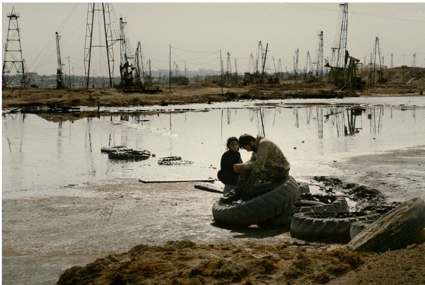
Кадр из фильма "Проповедь рыбам"