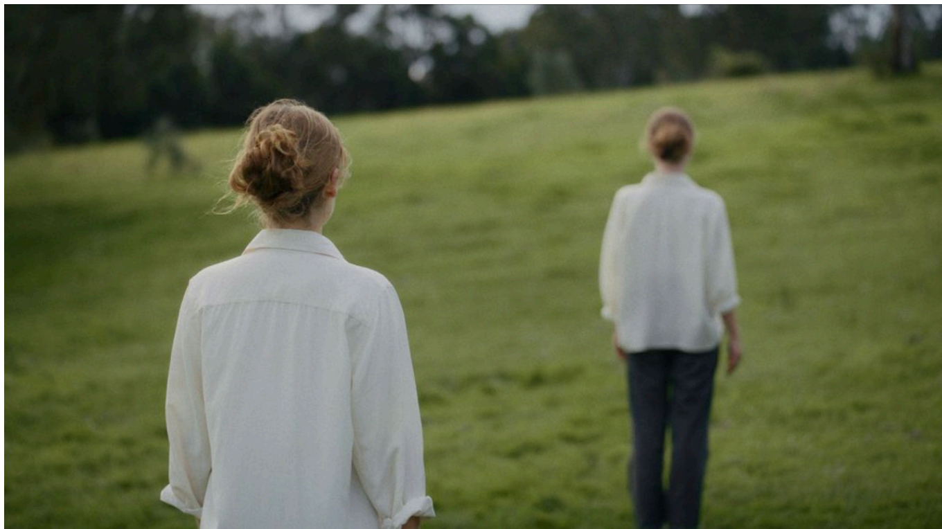
Кадр из фильма "Бензин"