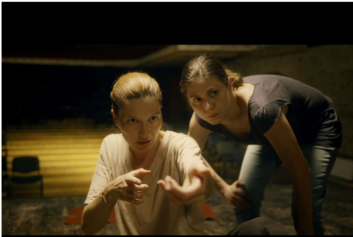
Кадр из фильма "Синдром Гамлета"

кинематограф последних лет», выразив восхищение его картинами и горечь от его гибели.