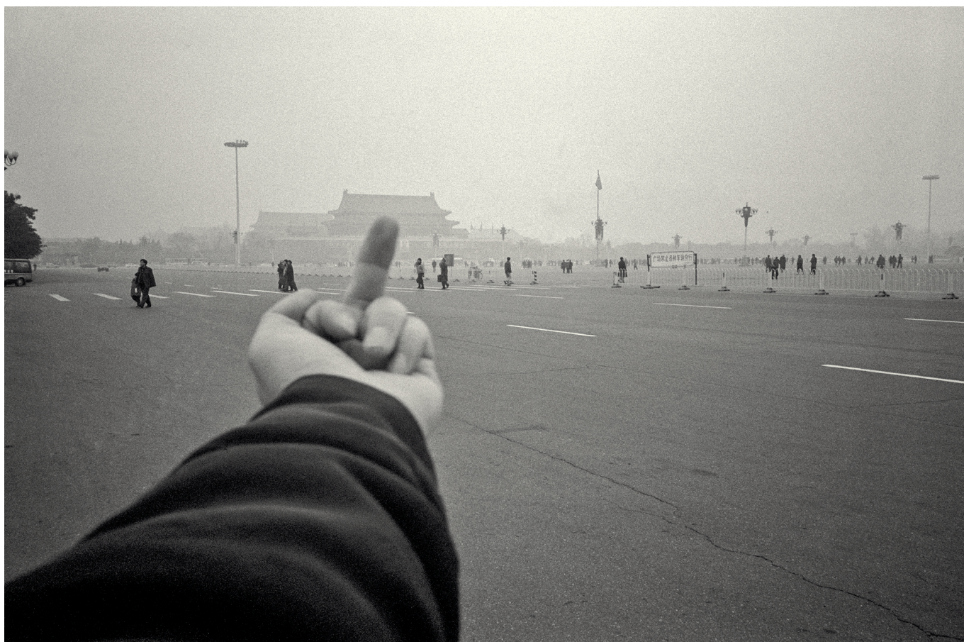
Площадь Тянаньмен, Пекин, 1995 г.