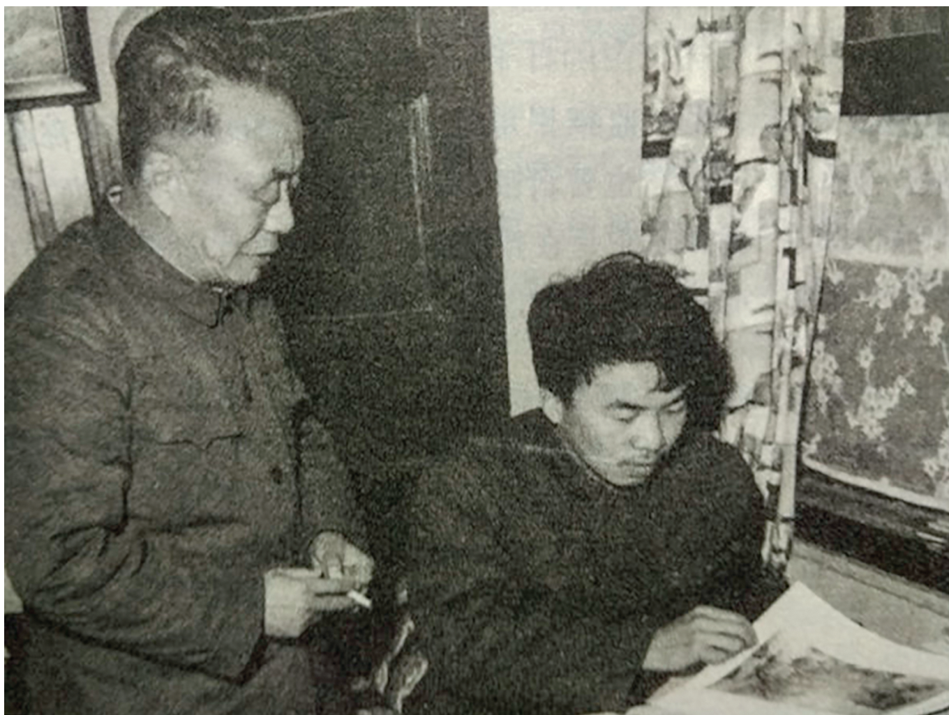
Ай Цин и Ай Вэйвэй дома, квартал Донгченг, Пекин, 1980 г.