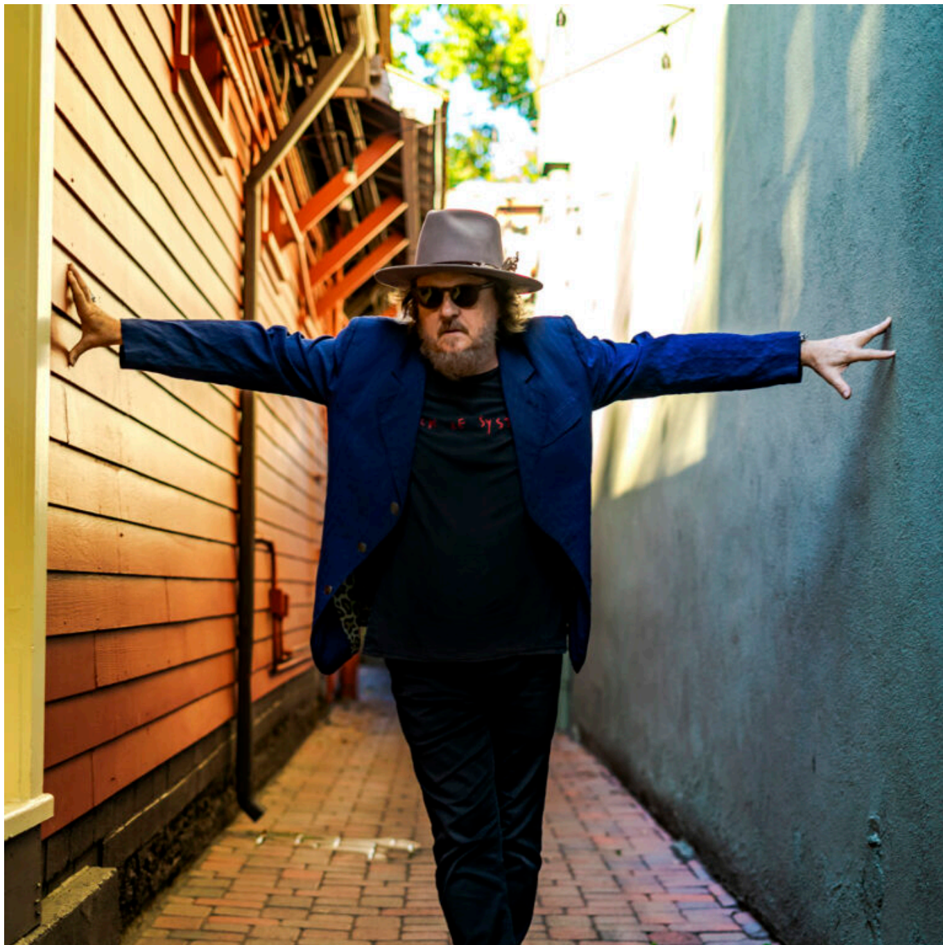
Неподражаемый Дзуккери

Напомним, что многих из включенных в программу музыкантов связывают долгие дружеские отношения с Montreux Jazz Festival. Так, именно в Монтрё в 2017 году Ибрагима Маалуфа заметил легендарный продюсер Куинси Джонс. А Дзуккери выступит на фестивале уже в четвертый раз: поклонники творчества автора хита Senza Una Donna , наверняка, помнят, как он «зажег» зал на концерте в Монтрё в 2018 году. В свои шестьдесят пять лет и с шестьюдесятью миллионами проданных альбомов, итальянец, несомненно, является одним из ведущих исполнителей блюз-рока в мире.