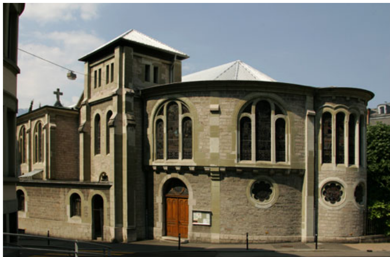
Церковь Сакре-Кер в Монтре

А теперь перенесемся на много столетий назад – в суровое Средневековье. Савойские герцоги, воздвигшие на берегу Лемана небольшой, но величественный Шильонский замок, увековеченный впоследствии лордом Байроном и Жан-Жаком Руссо, не забыли и о домово́й церкви: дворцовая часовня святого Георгия является настоящим архитектурным чудом, изящным украшением мрачной крепости. Историки полагают, что часовня была сооружена в XIII веке.