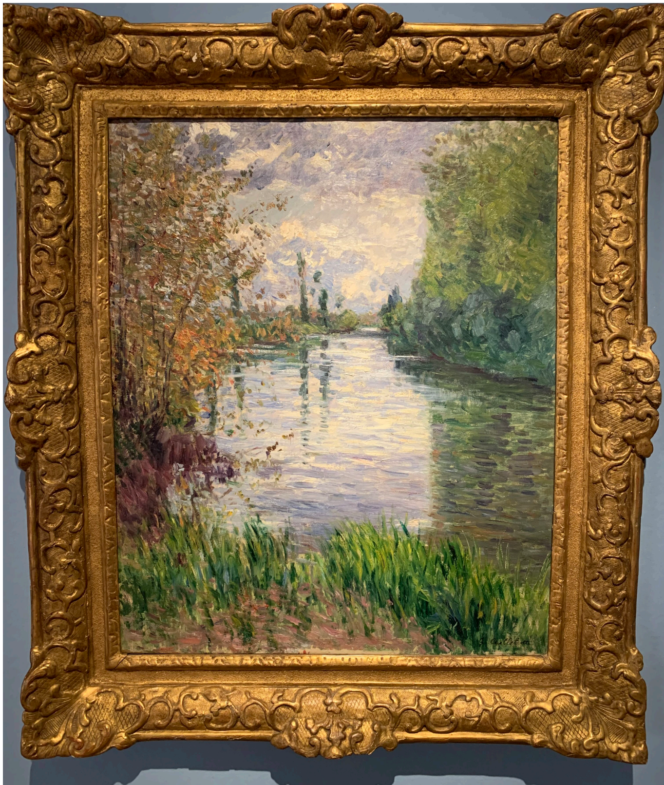
Густав Кайботт (1848-1894). Приток Сены осенью, ок. 1890 г. (Toulouse Fondation Bemberg)