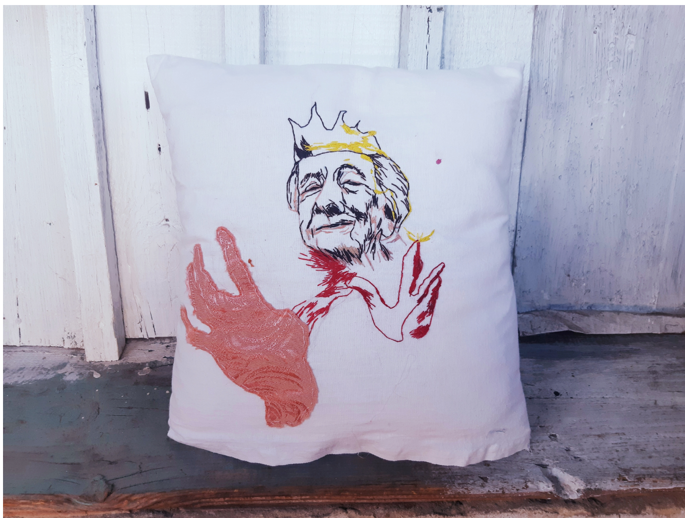
"Подушка безопасности".

Пандемия застала меня весной на Кавказе – в доме, где я выросла. Для меня это было невероятное время переосмысления, уединения, слияния с природой. Не могу сказать, что это было тяжело. Я много вышивала, ходила по лесу и работала, не ощущая давления мира. Меня лично сильно сбивает с толку, когда я понимаю, что все вокруг что-то делают, кто-то где-то выставляется – этот постоянный бег меня очень отвлекает. А тут не я одна, а все остановились. Это был период внутреннего роста и диалога с природой, которая для меня имеет важное значение. Мне интересно следить, как мы с ней связаны и как разделены.