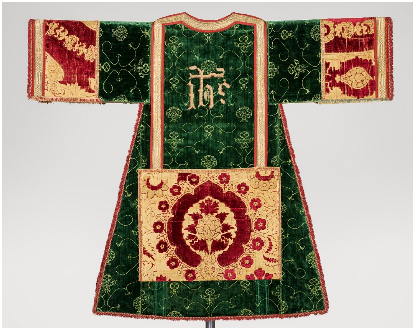
Далматика, Испания, 1480-1490 гг. Fondation Abegg, no inv. 269.

Любопытный факт: большинство мусульманских тканей того периода сохранились до наших дней благодаря ... католической церкви. Дело в том, что красивый текстиль часто использовался для хранения реликвий или украшения алтаря, а также в качестве далматики – праздничного литургического облачения диаконов. Католиков не останавливал даже тот факт, что на многих тканях были вышиты коранические термины, например, слово «барака», означающее на арабском «божественное благословение». В фонде Абегг представлено несколько подобных экспонатов: два больших шелковых полотна, в которые были обернуты мощи раннехристианской мученицы Либераты, и два фрагмента одеяний канонизированных священнослужителей.