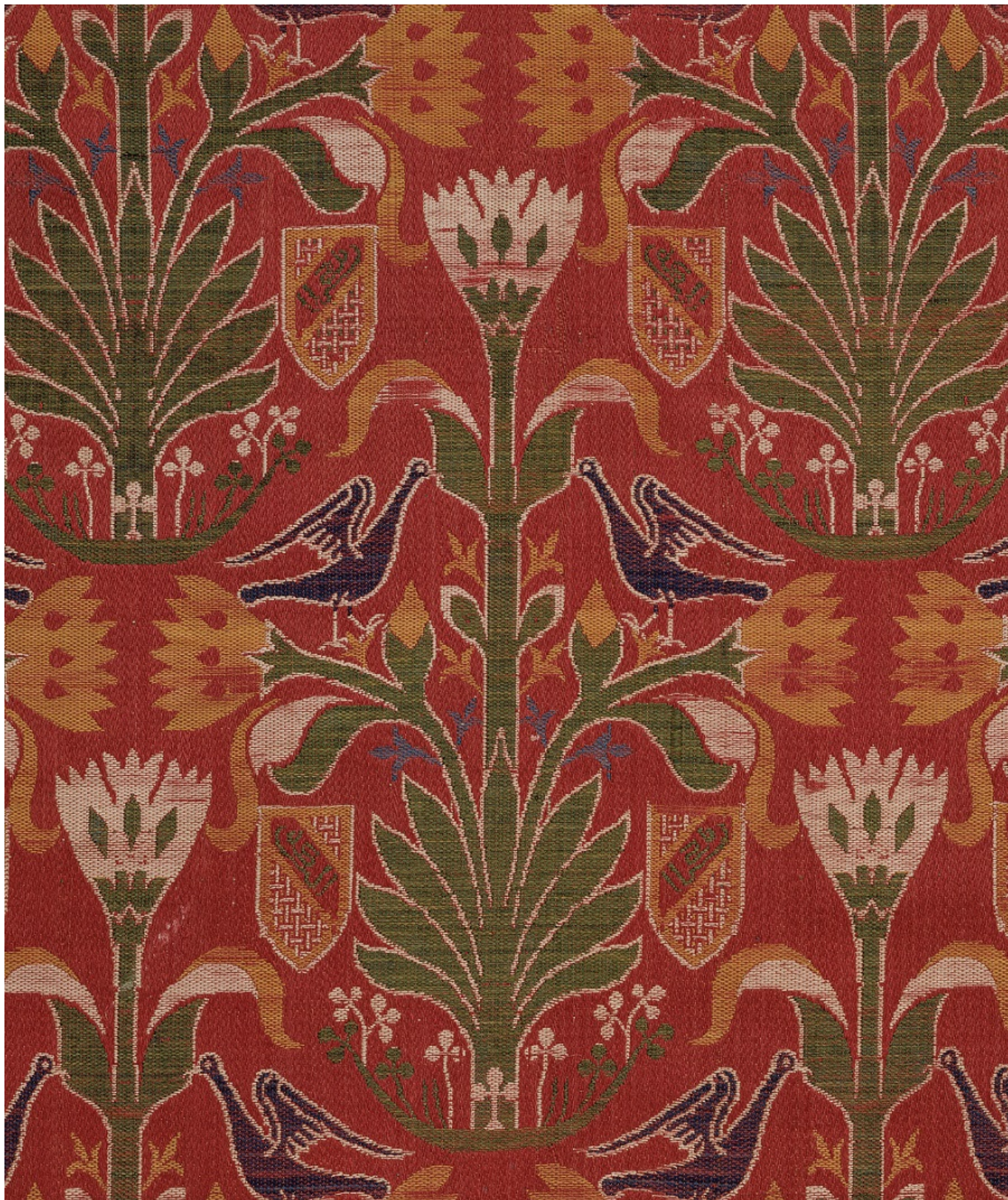
Шелковая ткань, Испания, вторая половина XV века. Fondation Abegg, no inv. 151

Добавим, что выставка полностью состоит из образцов, хранящихся в запасниках фонда Абегг. Расположенный в крохотной деревеньке Риггисберг, в Бернских Альпах, музей славится не только своей коллекцией исторического текстиля, но и уникальной, причем не только по швейцарским, но и по мировым меркам, реставрационной мастерской, эксперты которой проводят сложнейшие работы по консервации и восстановлению тканей, возраст которых превышает несколько сотен лет. Посетители музея также могут полюбоваться интерьерами виллы, на которой