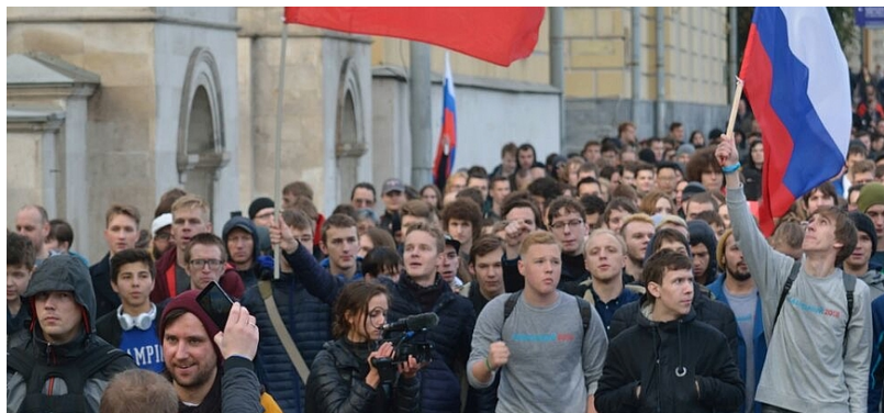
Кадр из фильма «Россия – это мы»