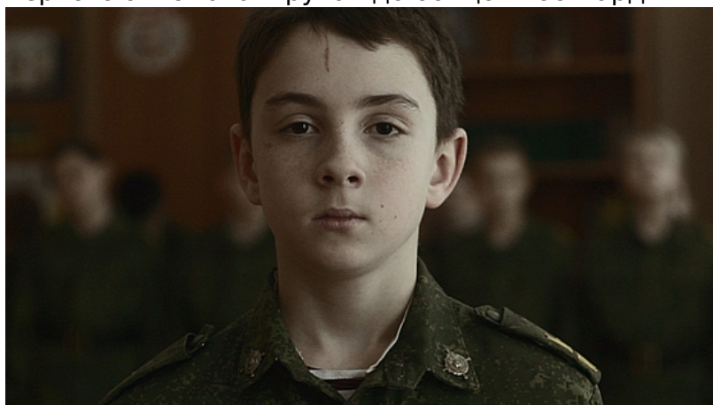
Кадр из фильма «Золотые пуговицы»