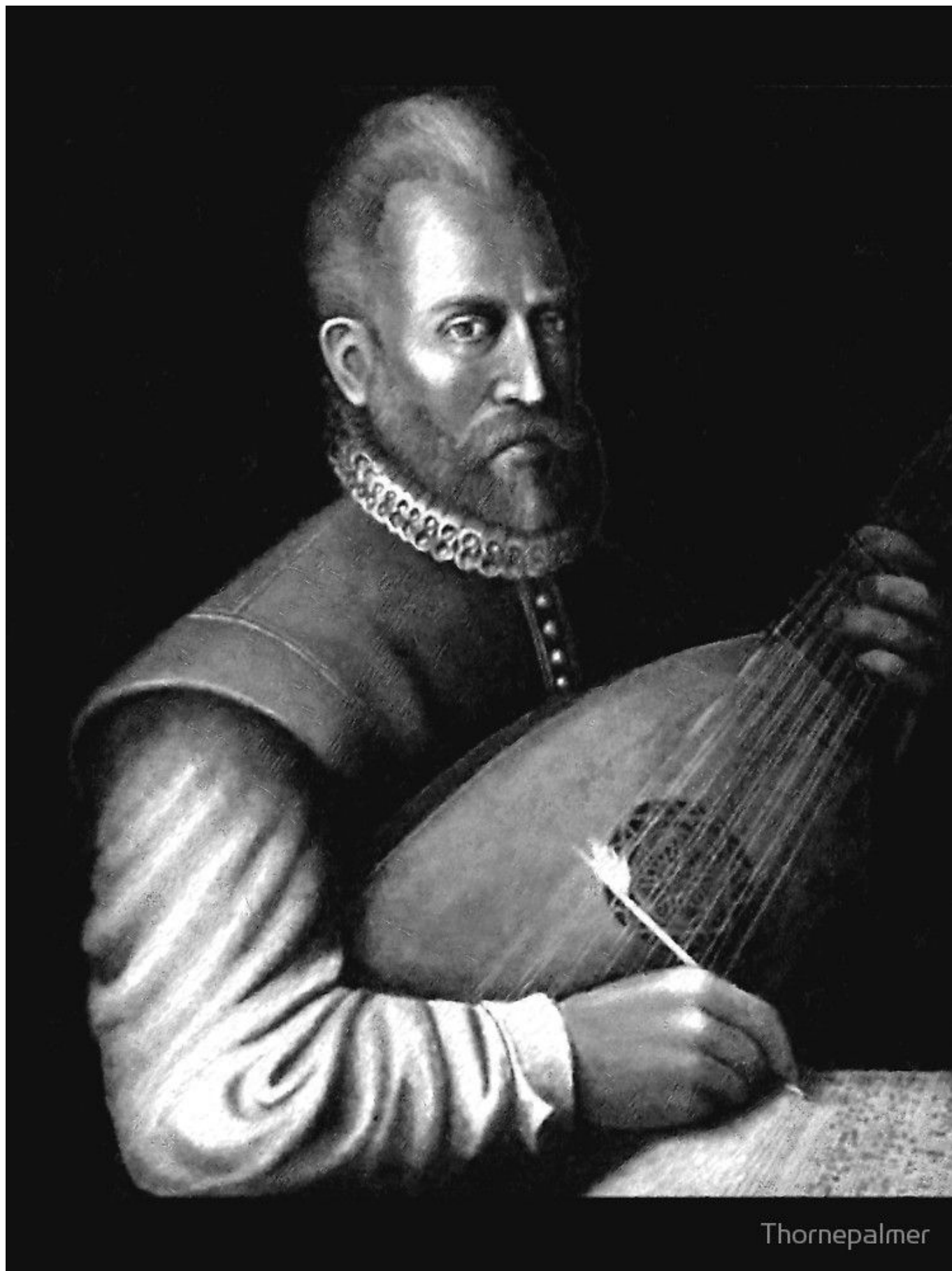
Джон Дауленд (DR)

Сочиняя в разные годы для альта и гитары (Nocturnal op. 70, 1963) Бриттен