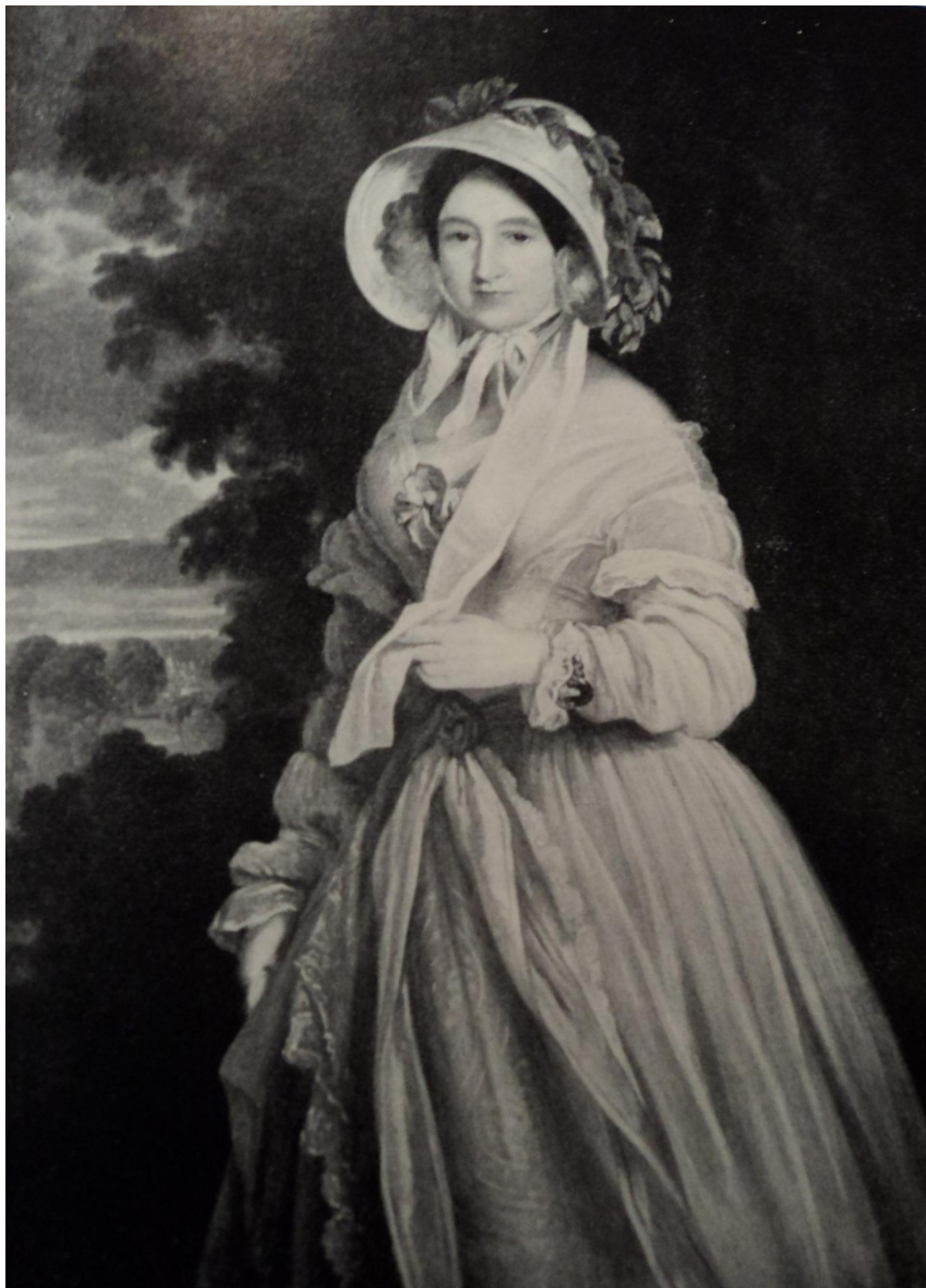
Великая княгиня Анна Феодоровна в Женеве. Холст, масло. Работа Франца Ксавера Винтерхальтера. Из книги Alville. La vie en Suisse de S.A.I. la Grande-duchesse Anna