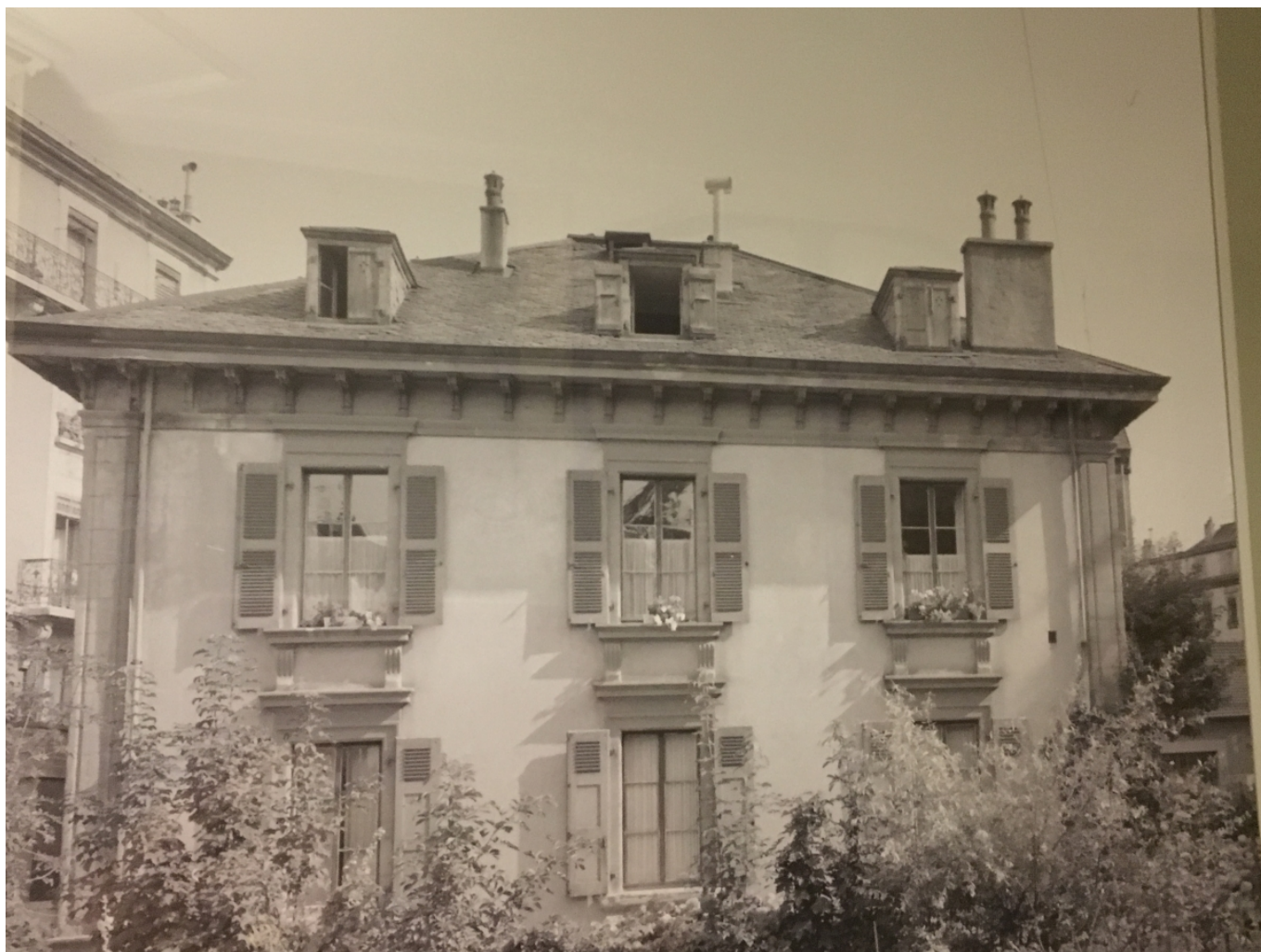
Фотография виллы «Фендт» в квартале Гротт, где родилась Эбергардт (дом не сохранился)

Изабелла выдавала себя за молодого алжирца, стремящегося познать отдаленные уголки родины, чаще всего называясь Махмуд Саади или просто Махмуд. Одет «Махмуд» был, естественно, в мужской костюм, но не в европейский, а в арабский: белый шерстяной бурнус и белый же высокий льняной тюрбан. Монохромность белого оживлял лишь коричневый цвет ремешков из шерсти верблюда, которыми был перевязан тюрбан.