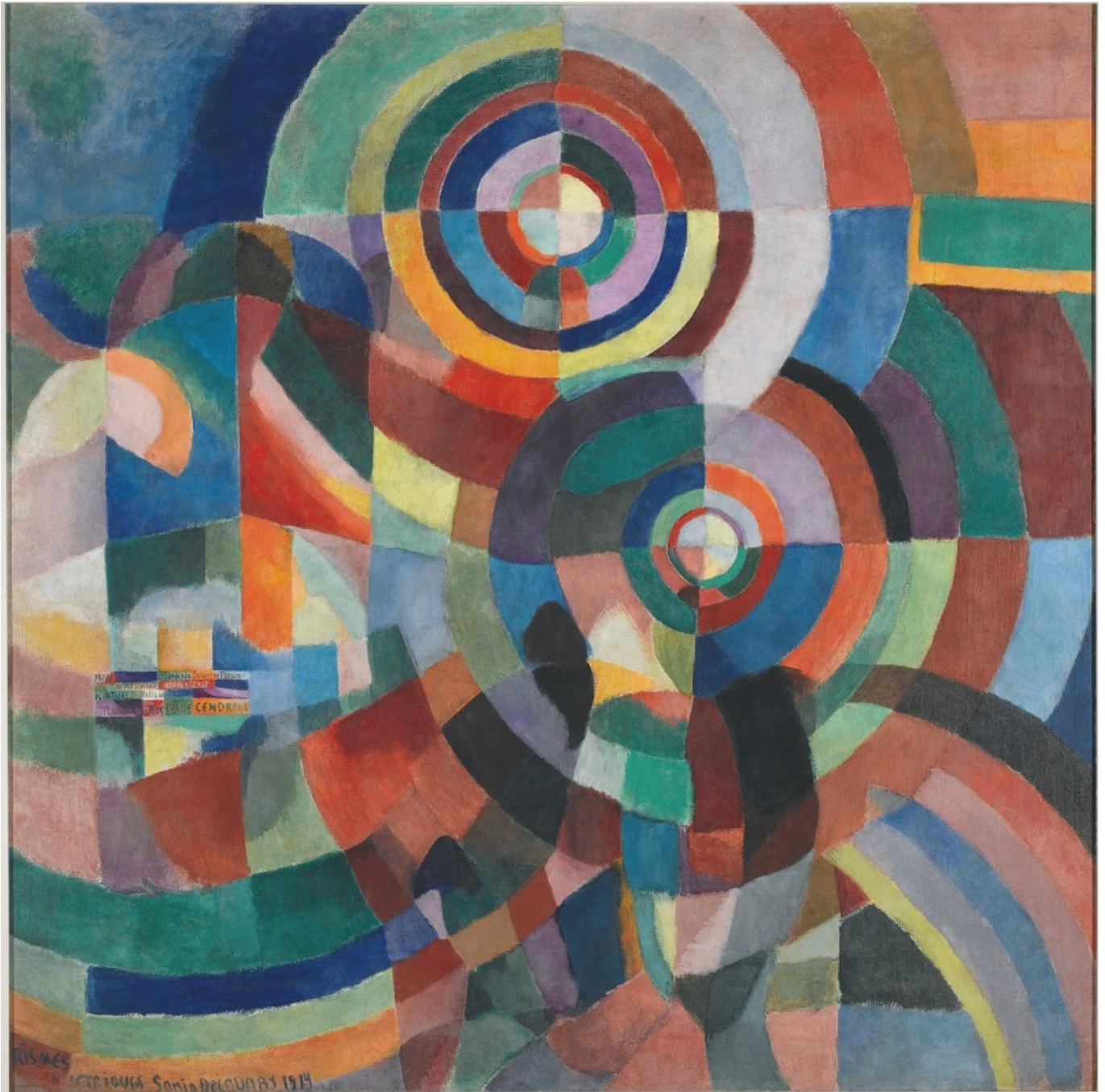
Prismes électriques, Sonia Delaunay, 1912

В кружок кубистов входили также поэты, писатели и критики, такие как Гийом Аполлинер, Макс Жакоб, Андре Сальмон и Пьер Реверди. Они собирались в «Бато-Лавуар» на Монмартре и вели ожесточенные споры о том, каким должно быть современное искусство. Пикассо поддерживал теплые отношения с писательницей, коллекционером искусства и критиком Гертрудой Стайн. На выставке можно увидеть ее портрет, написанный Пикассо в 1906 году и привезенный из музея Метрополитен. По воспоминаниям Стайн, она позировала для этого портрета более 80 раз, но Пикассо никак не мог написать ее лицо. В конце концов, он сказал, что больше не может ее видеть и уехал дописывать картину в Испанию. Когда Стайн увидела готовый портрет, то сказала, что не похожа на себя: действительно, ее лицо выглядит как застывшая иберийская маска. Для Пикассо эта работа, где уже можно проследить его стремление к упрощению формы, стала переходной от розового