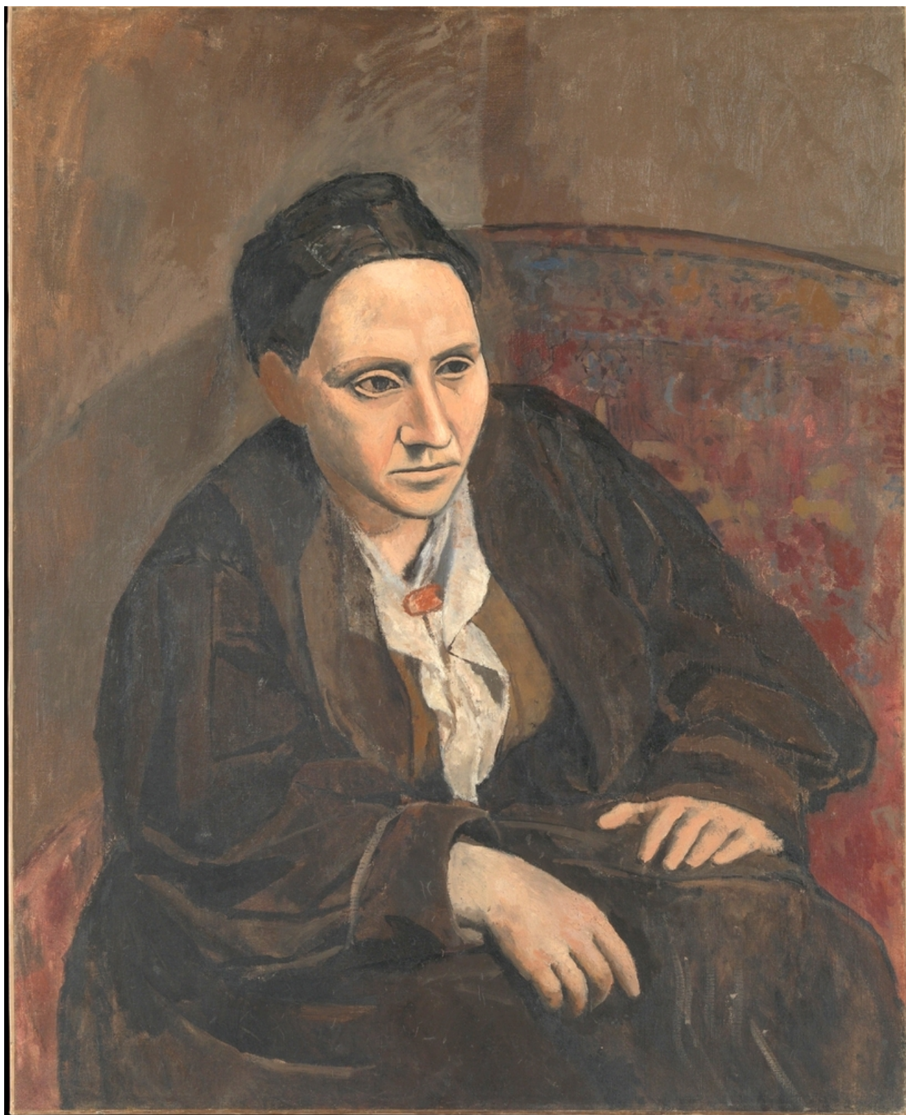
Портрет Гертруды Стайн. Пабло Пикассо, 1906.

Первая мировая война положила конец художественным опытам. Леже, Глез, Вийон и другие художники были призваны на фронт. Пикассо, будучи иностранцем, остался в Париже и, желая отдать дань уважения своей новой родине, написал французский флаг на натюрморте «Да здравствует Франция!». В 1915 году Жорж Брак получил тяжелое ранение и смог снова взять в руки кисть и палитру только в 1917-м, начав писать уже совсем иначе. Фактически в 1918 году кубизм прекратил свое