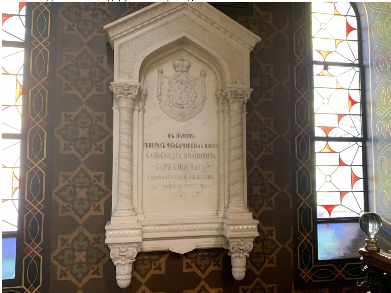
Мемориальное напоминание о кончине князя Барятинского в Крестовоздвиженском соборе Женева

принадлежу к числу людей, сделавших блестящую карьеру под его начальством. Много в свое время праздные языки болтали о нем всякого вздора, но едва ли тысячная доля этого вздору была справедлива».