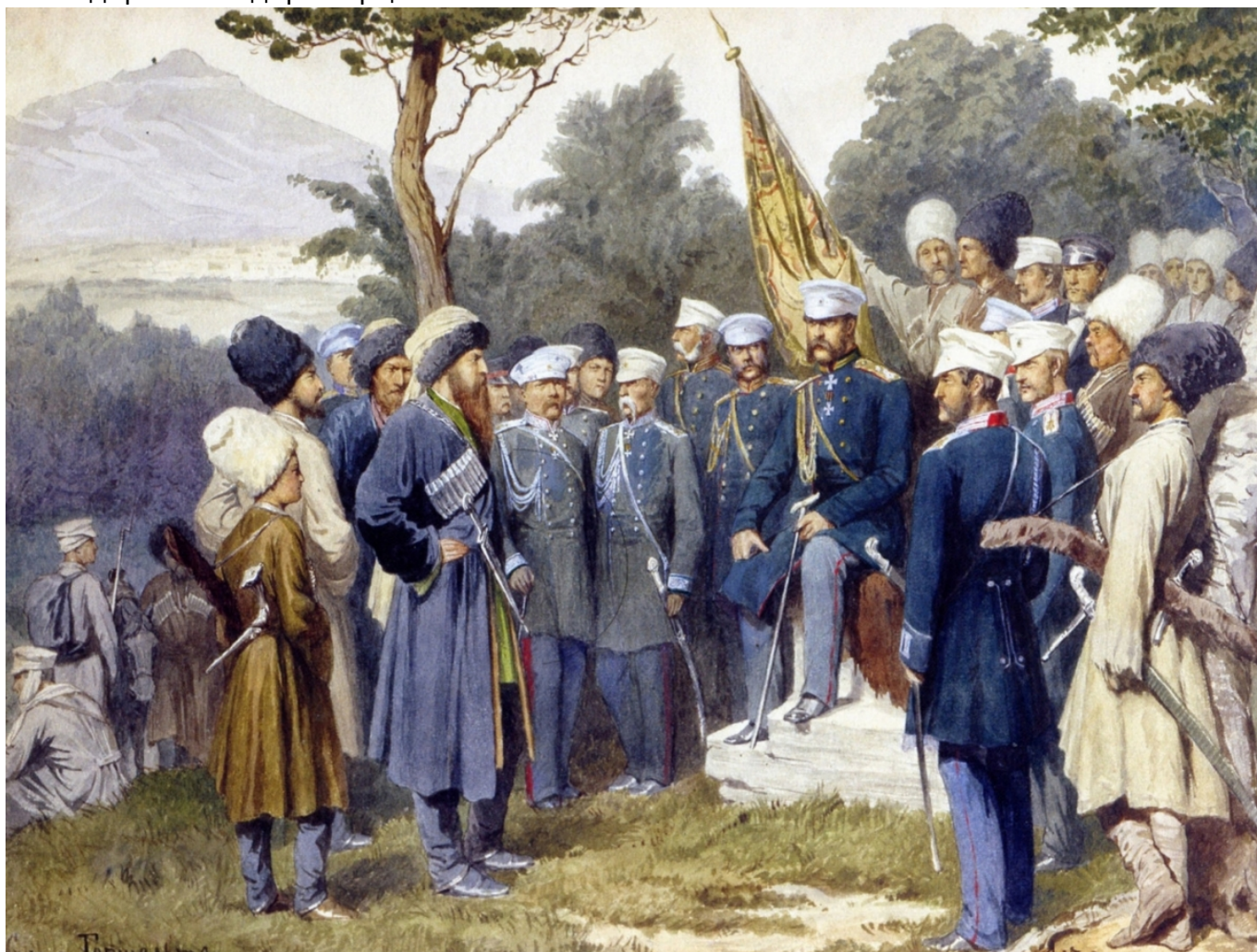
А. Д. Кившенко. Имам Шамиль перед главнокомандующим князем А. И. Барятинским, 25 августа 1859. (1880)

А. И. Барятинский был педантично требователен, строго наказывал за несоблюдение дисциплины и за три года смог сломить сопротивление войск Шамиля, взяв легендарного лидера горцев в плен.