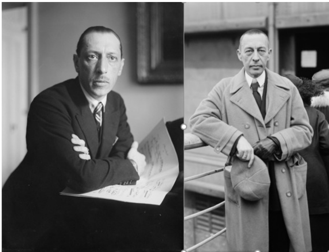
Игорь Стравинский, Сергей Рахманинов (Wikipedia)

Auteur: Надежда Сикорская, Женева , 18.01.2019.