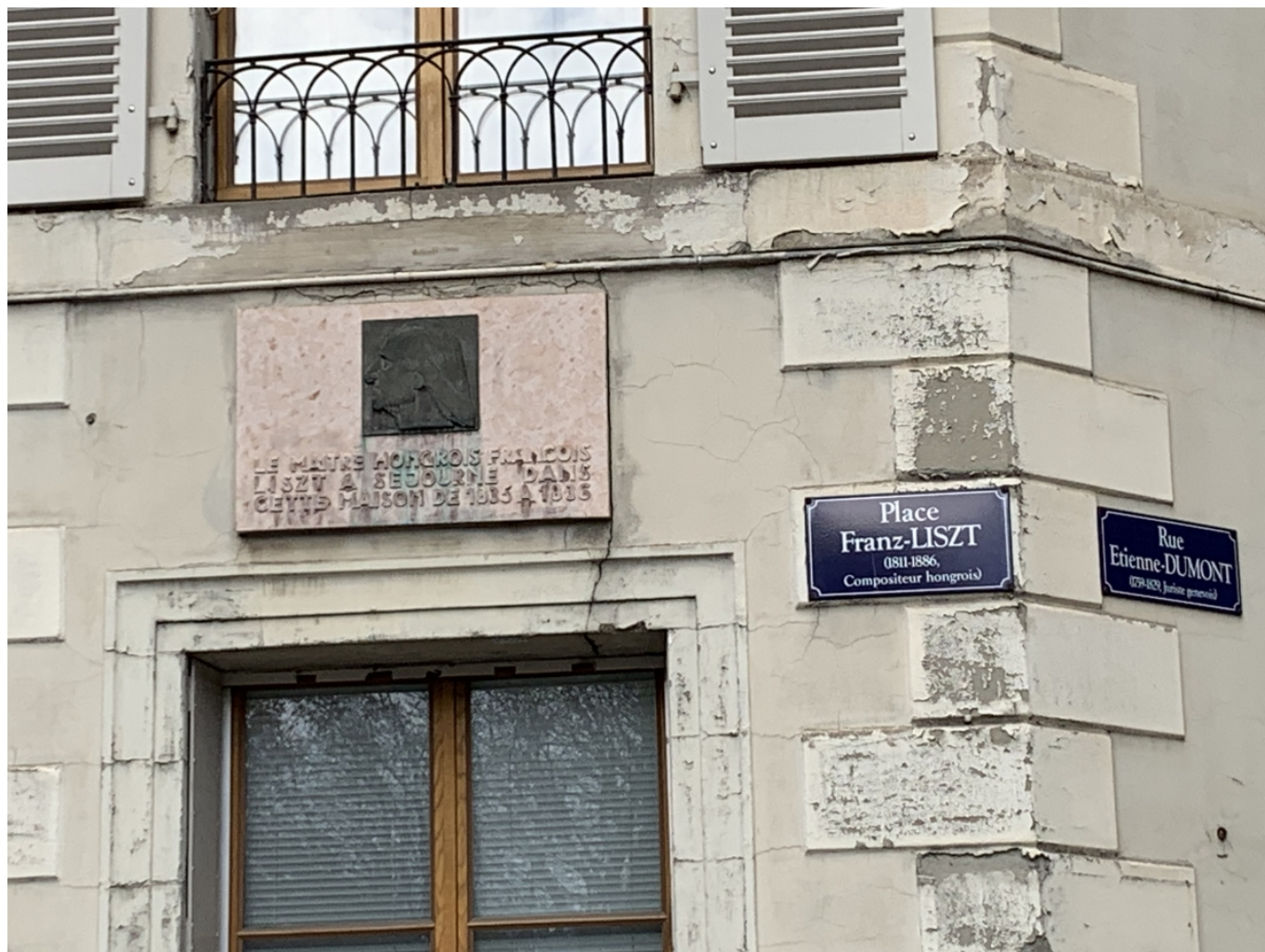
Площадь Ференца Листа в Старом городе Женевы