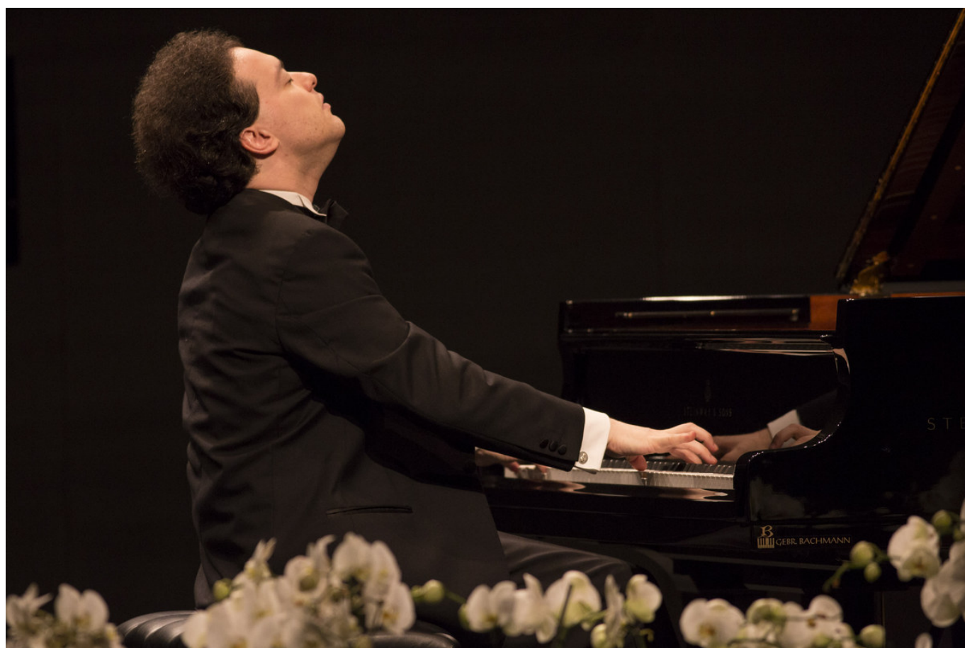
Играет Евгений Кисин