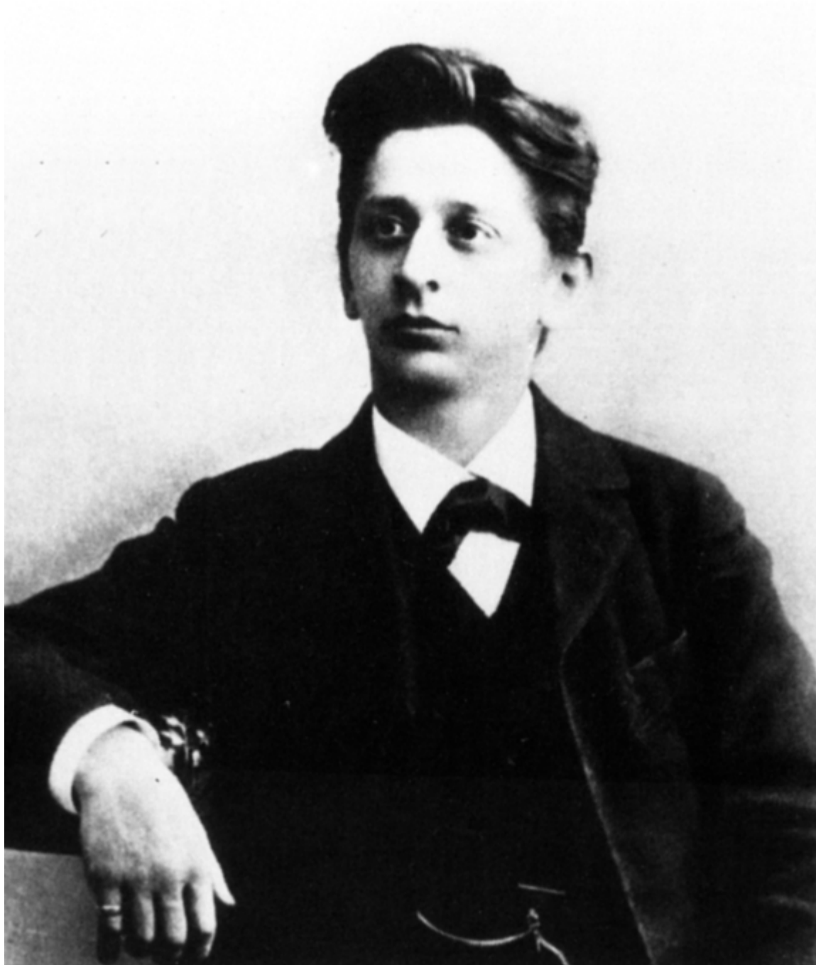
Александр фон Цемлинский (1871-1942)

Во втором отделении концерта публика услышит фантазию «Русалочка» (Die Seejungfrau) Александра фон Цемлинского (1871-1942). Биография его необычна и рассказы о нем почти всегда начинаются с описания экзотической словенско-сефардско-боснийской смеси кровей, которая текла в жилах австрийско-американского композитора, и о решении его отца перейти из католичества в иудаизм, но при этом модифицировать фамилию Землинский в аристократически звучащую «фон Цемлински». Принято также вспоминать, что Цемлинский был влюблен в Альму Шиндлер, будущую жену Густава Малера. Добавим также, что он приходился дальним родственником Арнольду Шёнбергу, для которого стал не только другом, но и первым и единственным учителем. Именно благодаря Цемлинскому, устроившему его дирижёром самодеятельного рабочего хора, Шёнберг смог бросить службу в банке и полностью посвятить себя музыке.