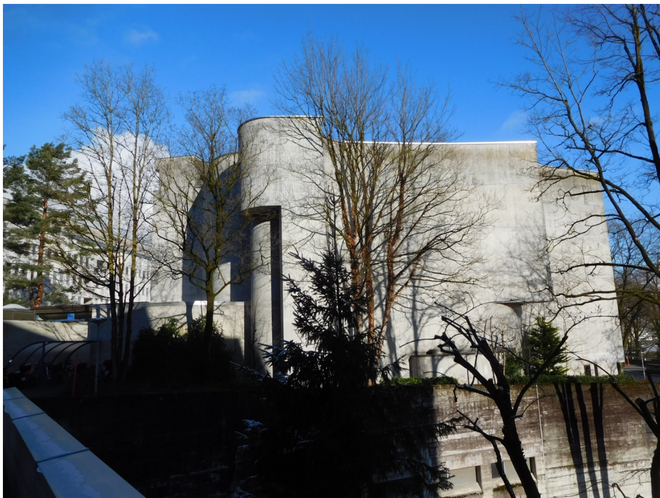
Современная бетонная церковь в Ингенболе, кантон Швиц

Мы уже не раз рассказывали о массовой культурной акции, охватывающей 50 стран и проходящей в Швейцарии с 1994 года. Ее основная цель – привлечь внимание публики к важным историческим памятникам и познакомить ее с профессиями и технологиями, необходимыми для их сохранения. Средство привлечения обычное – бесплатный вход и, в ряде случаев, эксклюзивность. Согласно имеющейся статистике, в общей сложности предоставленной возможностью с радостью пользуются ежегодно около 20 миллионов человек. На наш взгляд, для 50 стран цифра не слишком впечатляющая.