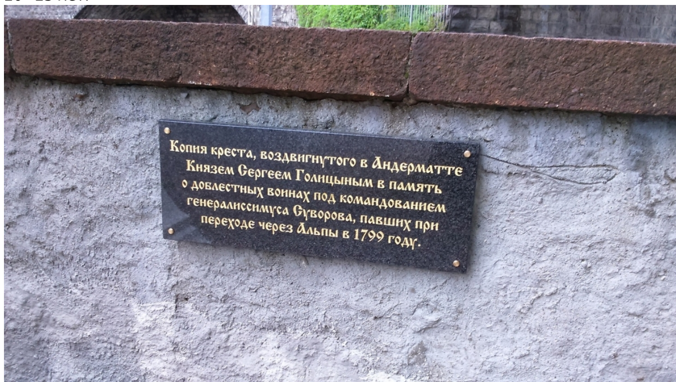
Памятная надпись на Суворовском кресте.

Заметим, что местные власти часто связывают все описываемые события по благоустройству не с осенним мини-юбилеем 2018 года, а с грядущим летом следующего, 2019-го, знаковым событием для города Веве и, пожалуй, всей Романдской Швейцарии – Праздником виноделов, который проводится здесь каждые 20–25 лет.