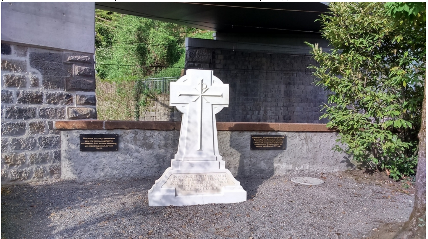
Суворовский крест во дворе храма.