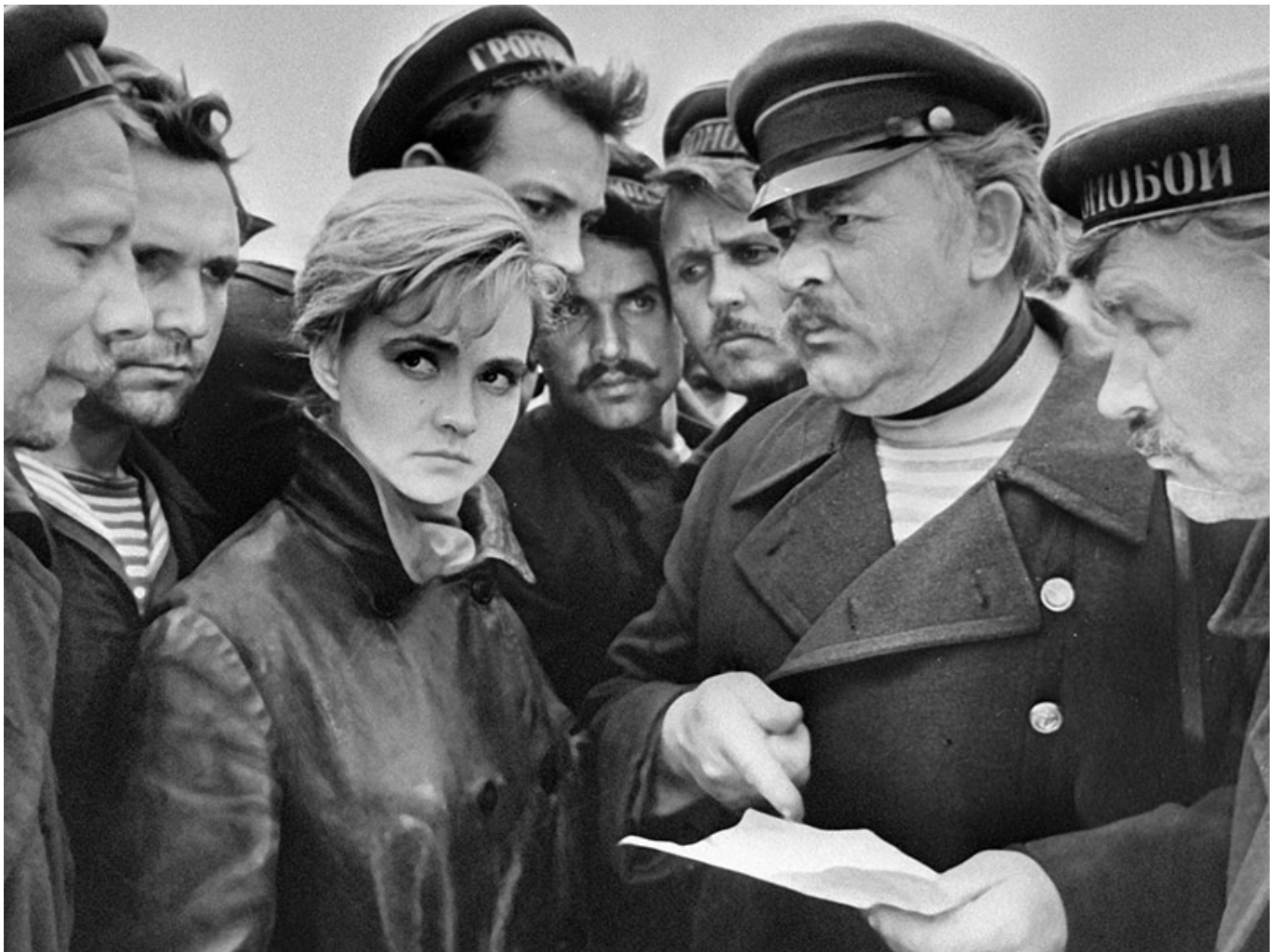
Кадр из фильма «Оптимистическая трагедия»

Auteur: Зарина Салимова, Берн , 16.11.2017.