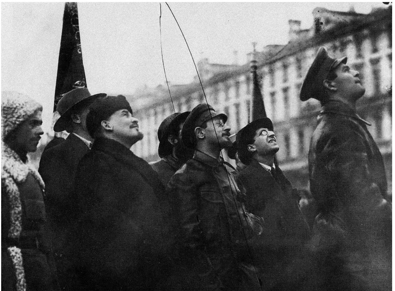
В. И. Ленин, Я. М. Свердлов, В. А. Аванесов на открытии временного памятника К. Марксу. Москва, 7 ноября 1918 г.

Революционеры делали выбор в пользу практичных вещей из носких и немарких материалов: особенно им полюбилась кожа. Не зря в своих воспоминаниях Лев Троцкий писал, что враги называли коммунистов «кожаными»: «Думаю, что во введении кожаной «формы» большую роль сыграл пример Свердлова. Сам он, во всяком случае, ходил в коже с ног до головы, т.е. от сапог до кожаной фуражки. От него, как от центральной организационной фигуры, эта одежда, отвечавшая характеру того времени, широко распространилась. Товарищи, знавшие Свердлова по подполью, помнят его другим. Но в моей памяти фигура Свердлова осталась в облачении черной кожаной брони – под ударами первых лет гражданской войны».