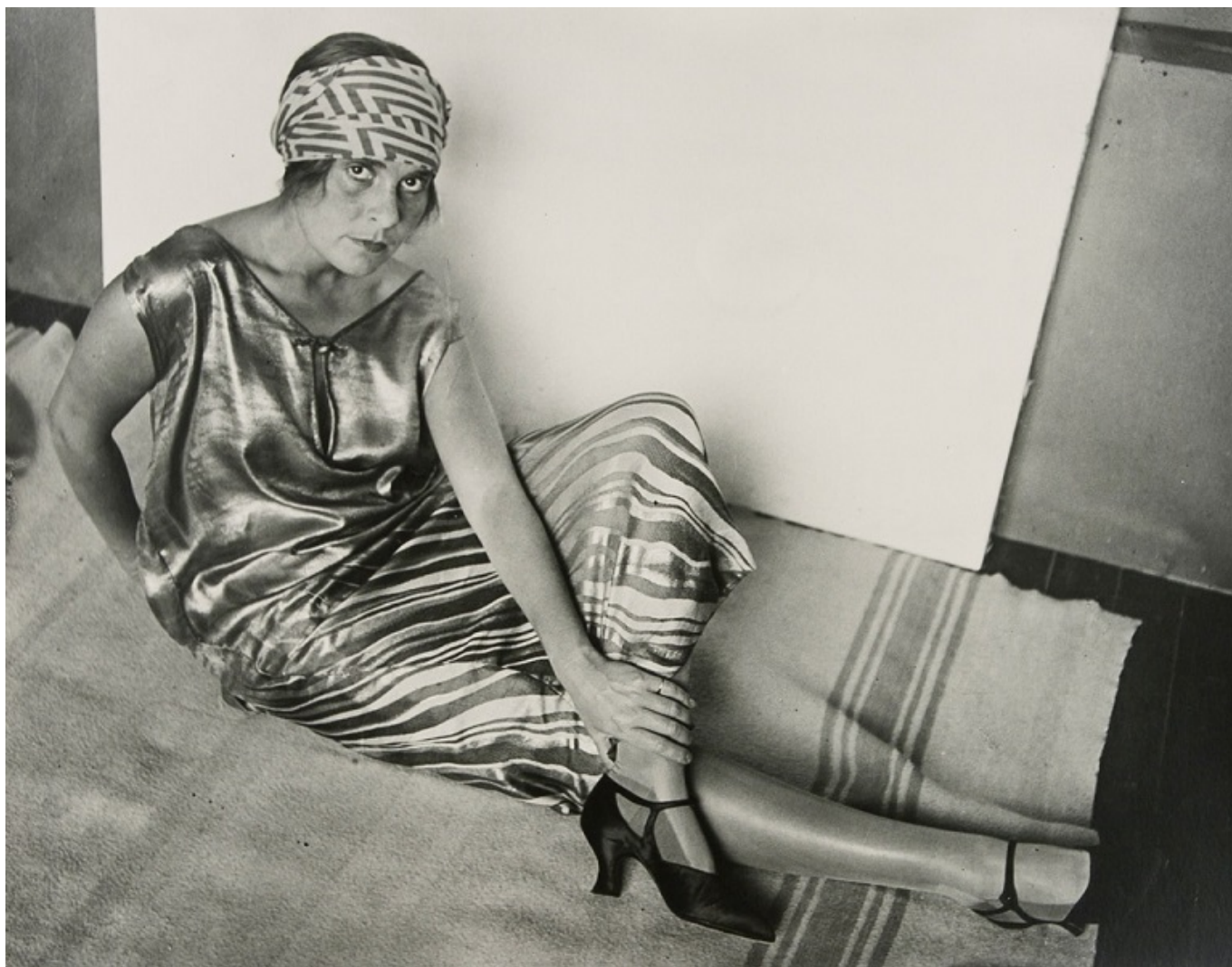
Лиля Брик в платке с экспериментальным рисунком

Короткая длина платьев породила проблему чулок, которых раньше просто не было видно. Как вспоминает Надежда Мандельштам, женщины бредили чулками, а достать их можно было только за границей. «Муза русского авангарда» Лиля Брик просила Владимира Маяковского привезти ей из Парижа вместе с духами и бусами рейтузы и дорогие чулки. «Без серпа и молота не покажешься в свете! В чём сегодня буду фигурировать я на балу в Реввоенсовете?!», - в стихах советский поэт высмеивал мещанство, а в жизни покорно исполнял все просьбы любимой женщины и покупал ей в командировках упаковки с чулками.