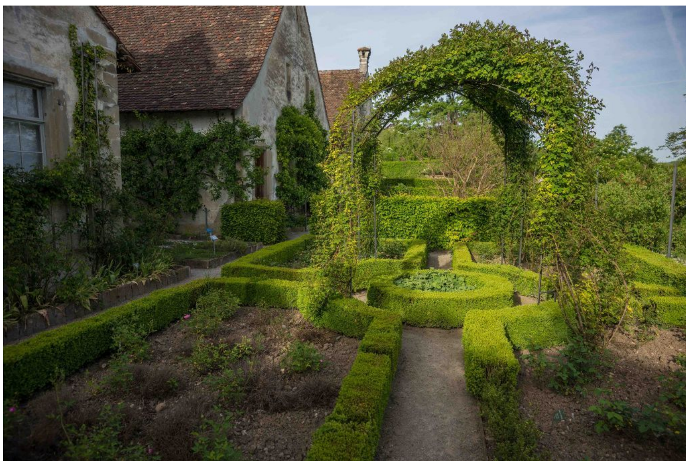
Сад лекарственных растений

Приблизительно в 800 году нашей эры сеньоры Иттинген построили на возвышенности недалеко от деревни Уэсслинген деревянную крепость. С IX по XIII века форт служил родовым замком семьи Иттинген – мелко аристократического рода, принадлежавшего к политическому течению гвельфов и выступавшего за ограничение власти императора Священной Римской империи. Начинается длинная история укрепленного замка, полная печальных и радостных событий. В 1079 году крепость была сожжена войсками настоятеля Санкт-Галленского аббатства в ходе противостояния между императором Генрихом IV и Папой Римским Григорием VII.