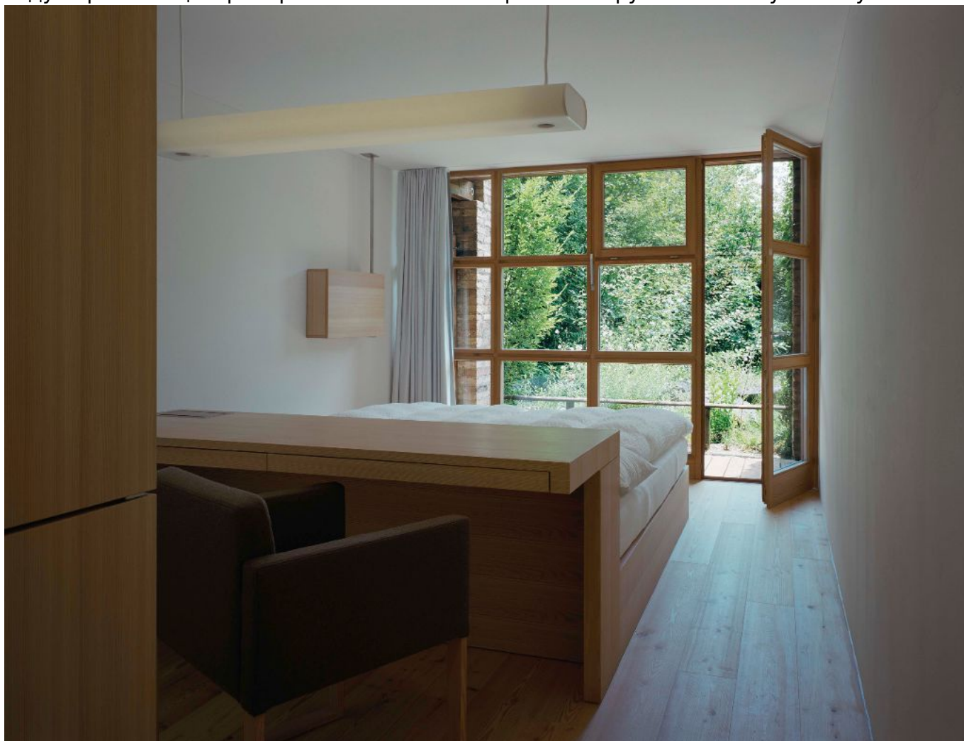
Монастырская гостиница (kartause.ch)

Неизвестно, как восприняли эту новость остававшиеся в Иттингене августинцы, чей устав значительно отличался от картезианского, но факт остается фактом: в 1471 году картезианцы приобрели обитель и построили вокруг нее высокую стену.