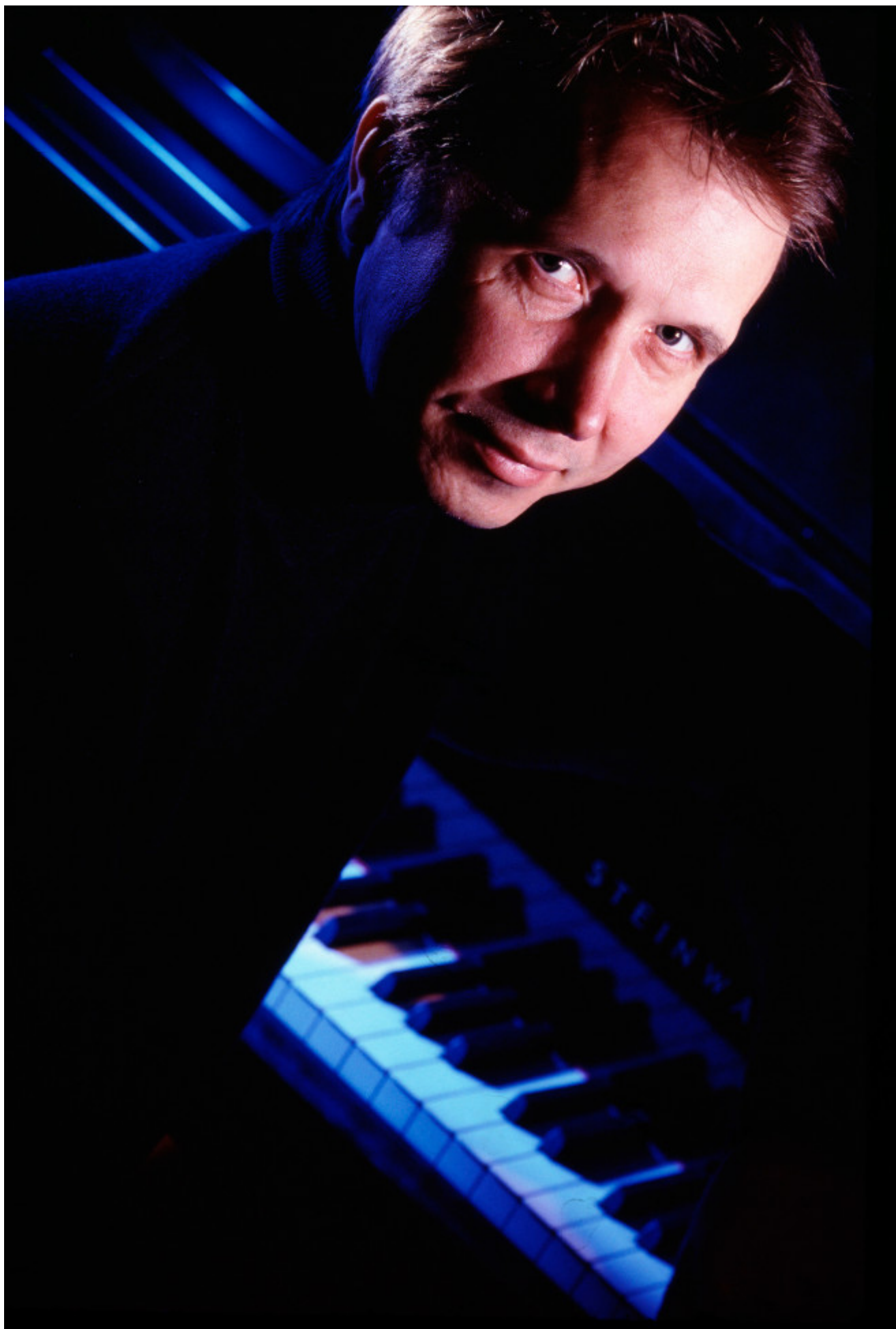
Михаил Плетнев