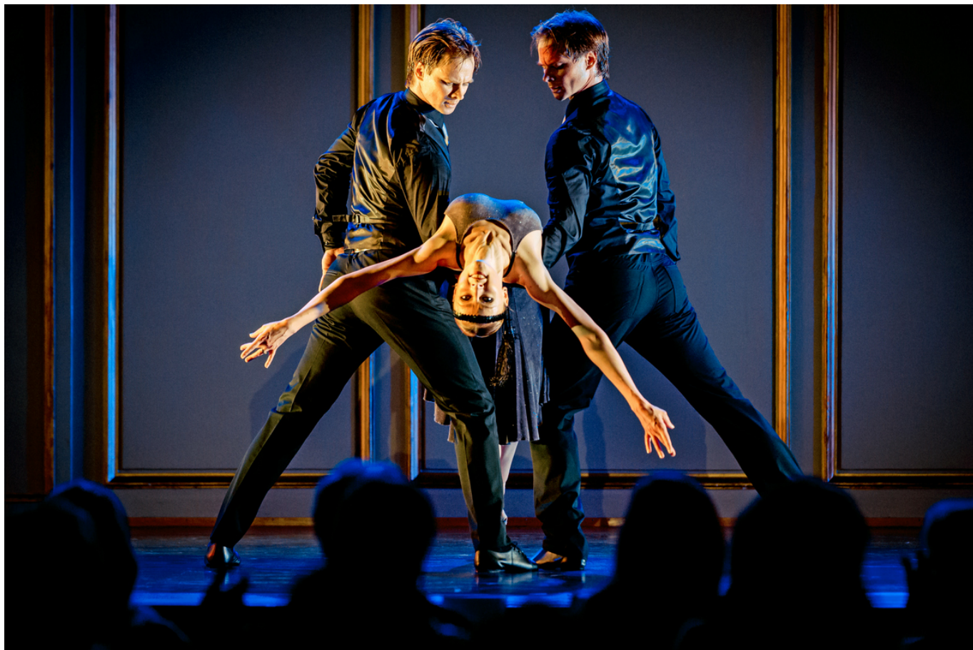
Фрагмент из балета "Let's Tango"

Auteur: Ксения Ноговицына, Биль/Бьенн , 02.06.2017.