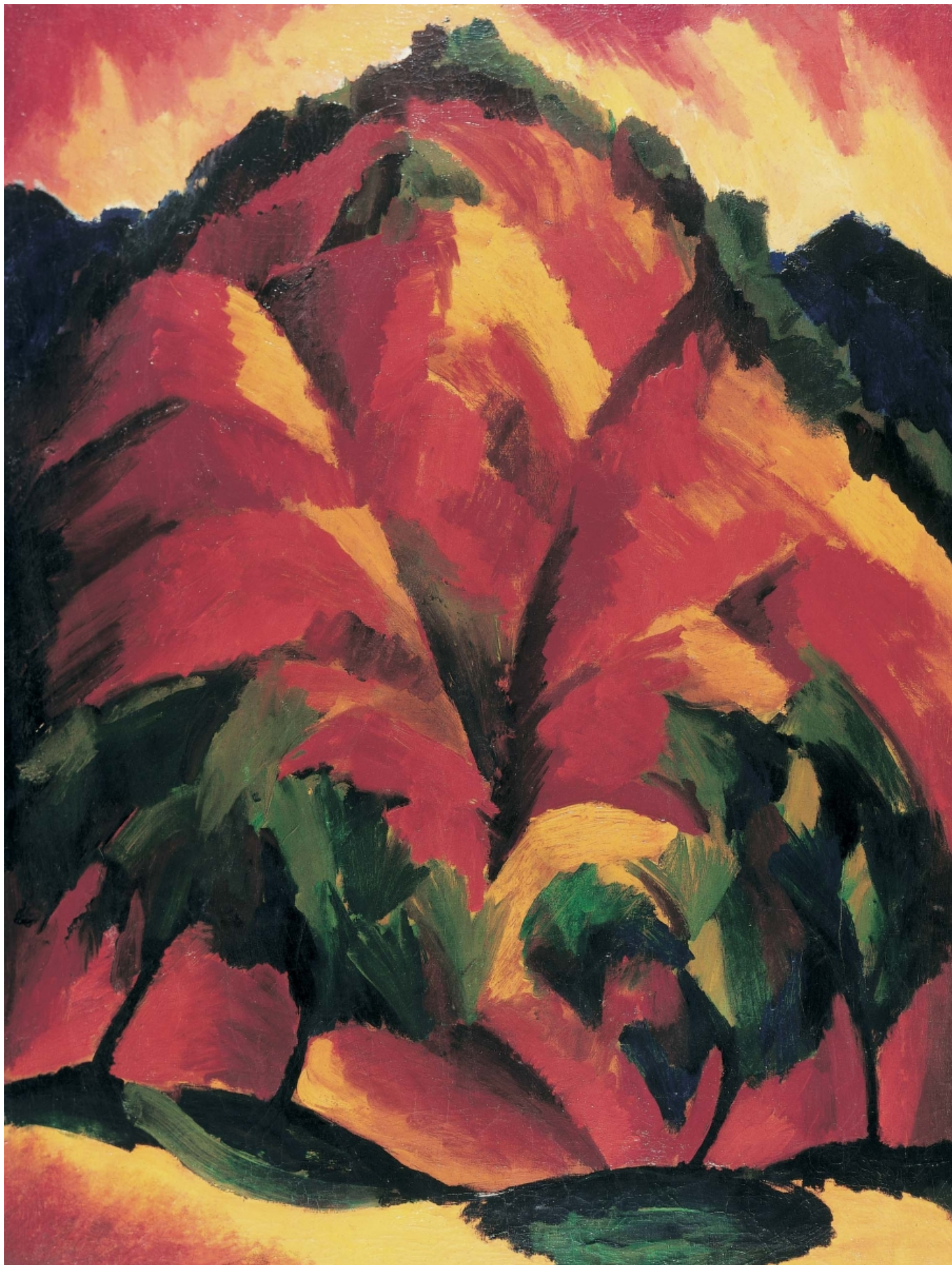
Михаил Ларионов (1881-1964). "Воображаемый пейзаж", 1908. Масло, холст, 109 х 62.5 см

Однако в области творчества, нам кажется, двух мнений быть не может: революция