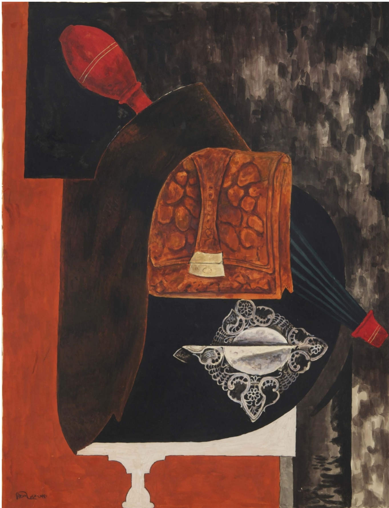
Иссахар-Бер Рыбак (1897-1935). "Композиция", около 1916-1917 гг. Масло, бумага, 70 x 53 см

В этом смысле мы вполне понимаем, какой смысл вложила директор галереи