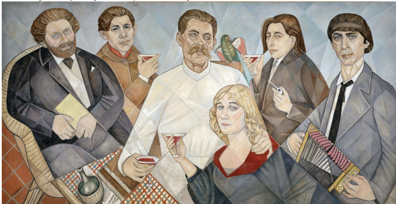
Мария Воробьева-Стебельская, известная как Маревна (1892-1984). "Посвящение монпарнасским друзьям", 1962. Масло, паватекс, 160 x 305 см