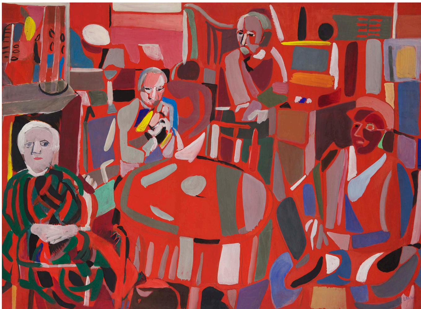
Андрей Ланской (1902-1976). "Без названия", около 1930 г. Гуашь, бумага, 73 x 100 см