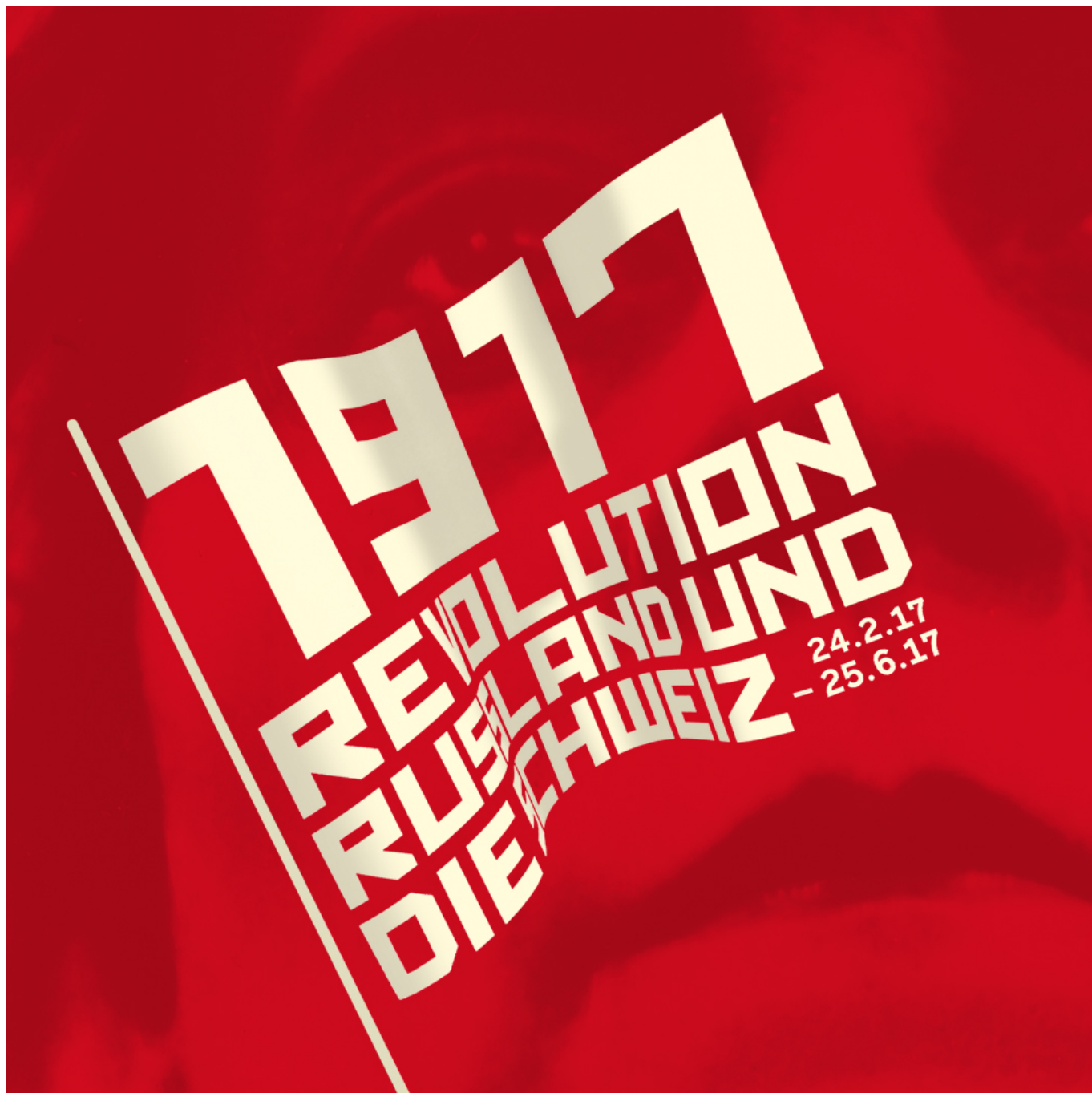
Удачно стилизованная афиша выставки

Не одного Ленина привлекала Швейцария. Она была вожде́нным местом для многих русских художников, композиторов, философов и прочих революционеров. Причины понятны: либеральная демократия и нейтральность в области внешней политики гарантировали всем свободы выражения и прессы. Кроме того, женщины могли учиться в университете – в России с этим еще предстояло подождать. Согласно переписи 1910 года, в Швейцарии проживало тогда около 8500 выходцев из европейской части России, причем половина из них – в Цюрихе.