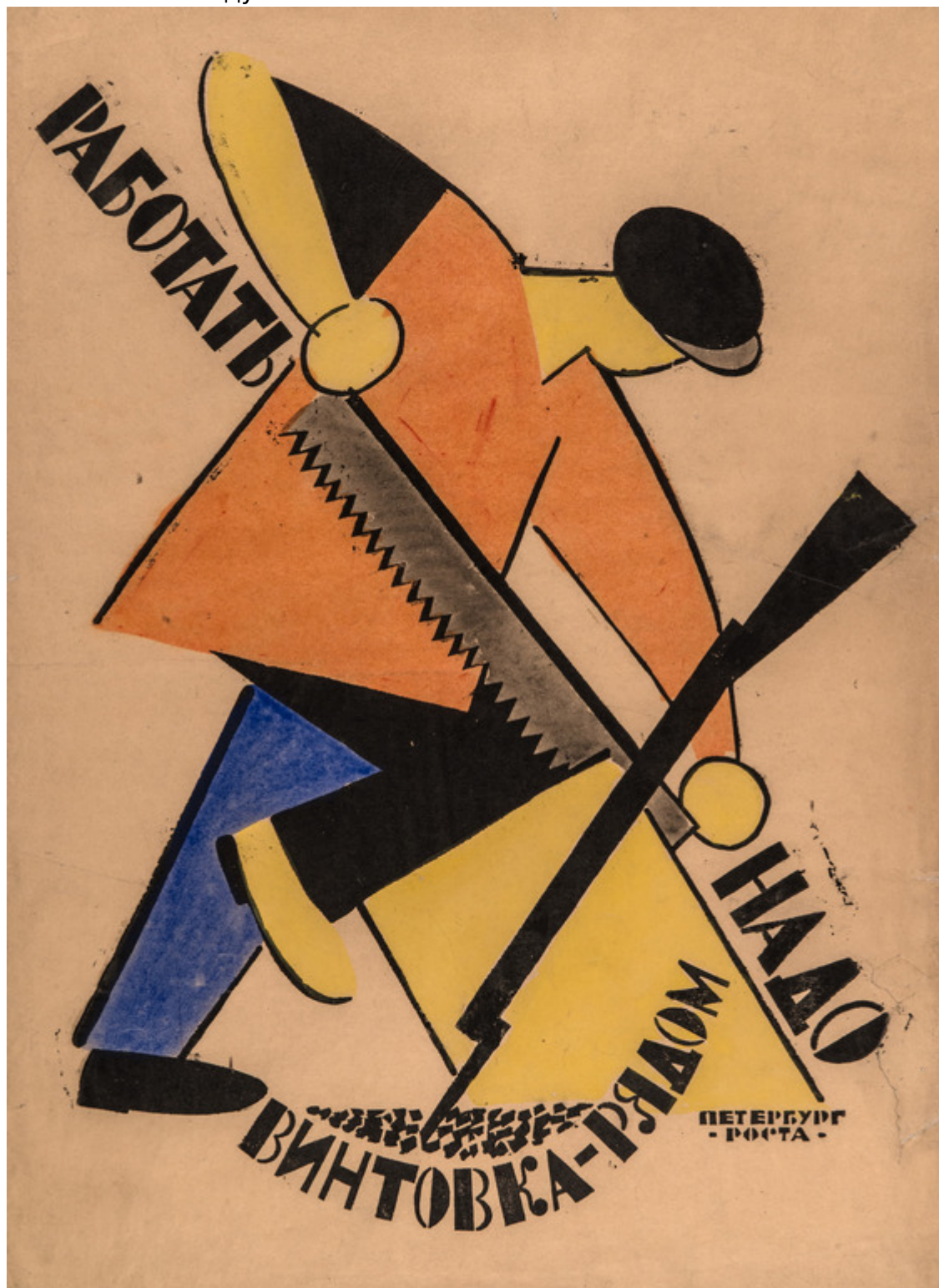
Владимир Лебедев, Владимир Маяковский. Плакат РОСТА «Работать надо, винтовка – рядом», 1920/21. Линогравюра, 77,7 x 56,5 см

Знают читатели Нашей Газеты.ch об охлаждении, а затем и разрыве российско-швейцарских дипломатических отношений после прихода к власти большевиков и начала гражданской войны. Фотографии, письма и официальные документы, которые можно увидеть на выставке в Цюрихе, дают представление о том, как слухи об участии Советской миссии в подготовке всеобщей швейцарской забастовки 1918 года возродили страхи перед нашествием коммунистов. В результате Советская миссия была из Швейцарии выдворена, а дипломатические отношения восстановились только в 1946 году.