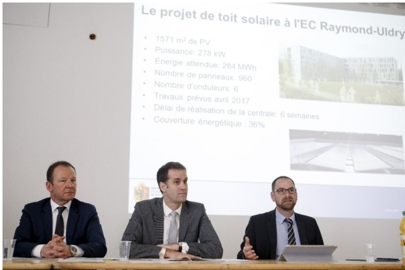
Презентация проекта в школе коммерции Раймона Юлдри

Кантон, последовательно выступающий за отказ от атомной энергетики и использование ископаемого топлива, строит вместе с SIG большие планы по увеличению доли возобновляемой энергии в общем объеме потребления. Министр энергетики Антонио Ходжерс, член Партии зеленых, напомнил, что Женева намерена к 2020 году на 15% снизить объем индивидуального потребления по сравнению с 2000 годом и «близка к тому, чтобы достичь поставленной цели».