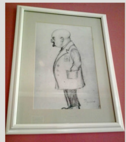
Мемориальный кабинет П.А.Герцена в МНИОИ им. П.А. Герцена (коллаг Е. Абаренковой)