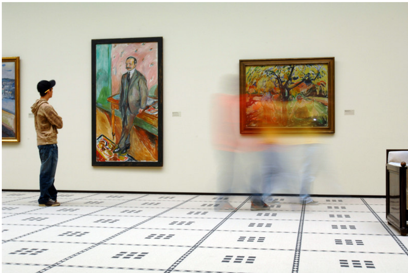
Эдвард Мунк в залах Кунстхауса

Auteur: Надежда Сикорская, Цюрих , 23.12.2016.