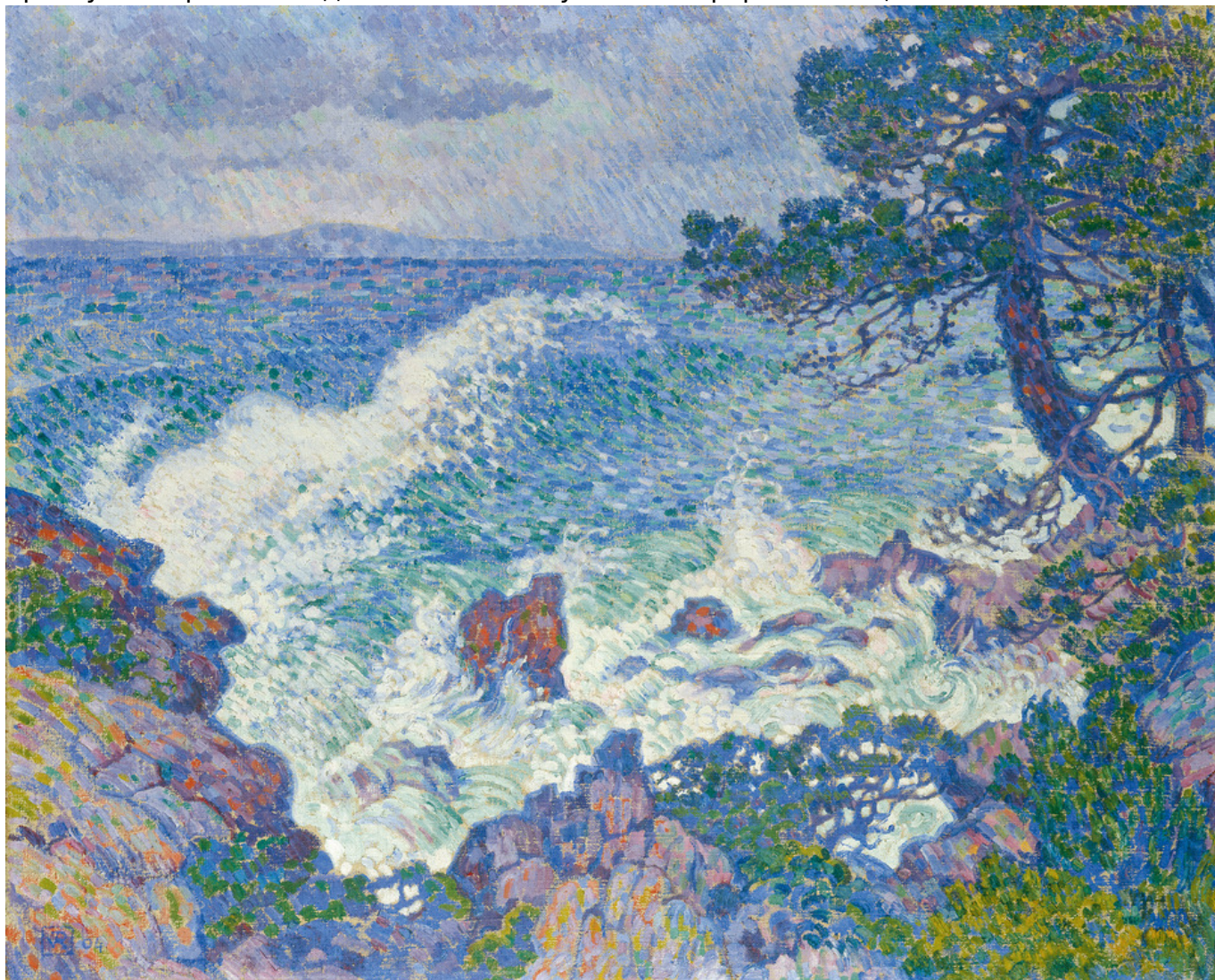
Тео ван Рейссельберге. Восточный ветер, 1904. Масло, холст, 81 x 100 см. Частная коллекция

Эрдмуте, вид на Хемниц из виллы, мадам Эш и еще один портрет Эрдмуте и Ганса-Герберта с няней, который неудовлетворенный автор порвал надвое. В воскресенье 29 октября Мунк, супруги Эш и шведский коллекционер Эрнест Тиль были приглашены на ужин к ван де Велде в Веймар, где через несколько дней Мунк приступил к работе над заказанным ему Тилем портретом Ницше.