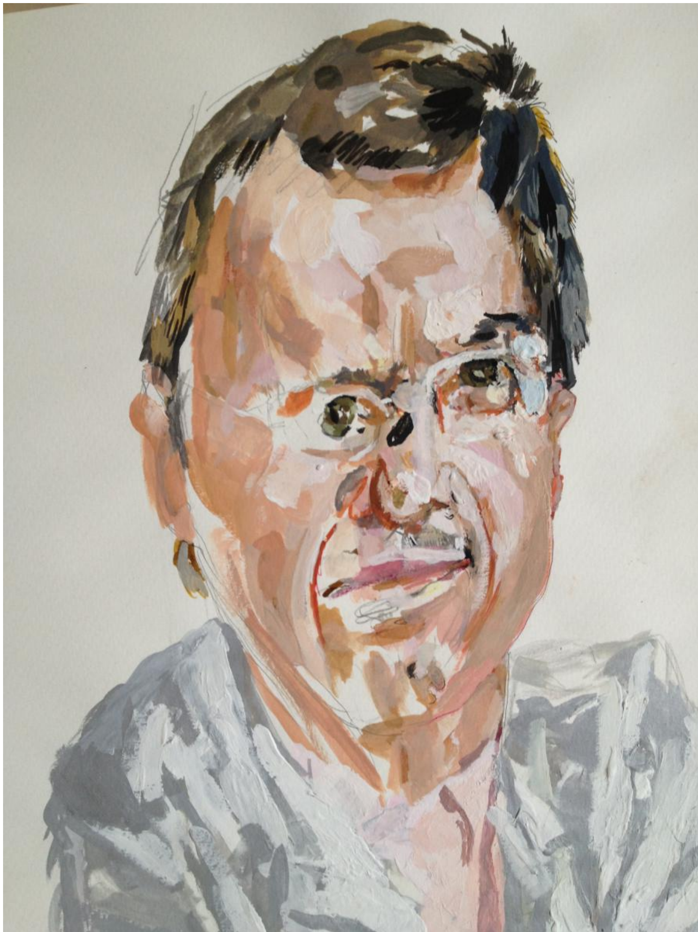
Портрет профессора Богуславского кисти Бориса Краснова

А каков был профессиональный повод для этого общения?