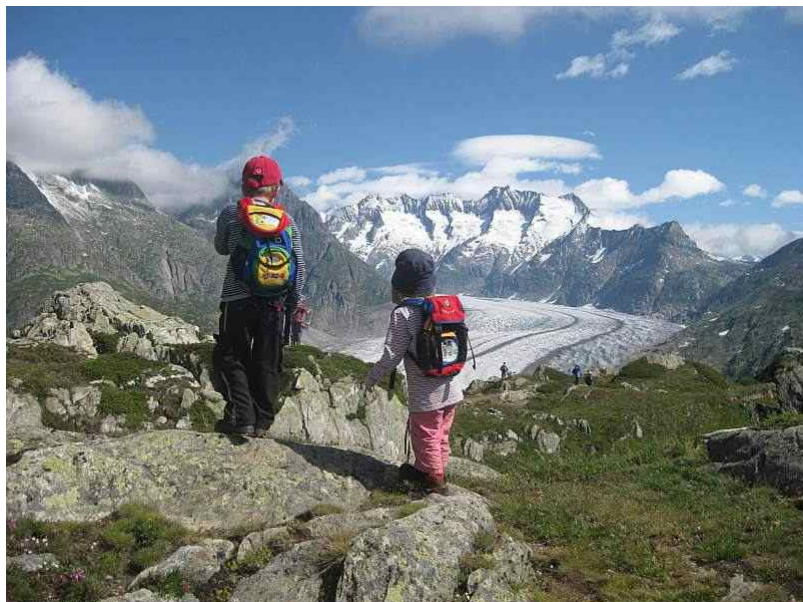
Навстречу природе...

В журнале природоохранной организации Pro Natura подчеркивается разница между идеализированными Альпами на фото, которые можно увидеть в брошюрах Suisse Tourisme, и тем, что они представляют собой в реальности. Реклама делает свое дело, продавая с помощью фотоснимков то, чего хотят туристы. Да, Церматт отражается в лазурной глади озерной воды, но при этом на вершинах Альп ежедневно толпятся туристы, там и тут грохочет техника, сооружая новые гаражи, рестораны и бутики... В погоне за новыми туристами и оживлением интереса тех, кто бывал здесь не раз, постепенно «осваиваются» новые нетронутые ранее площади, что наносит серьезный урон великолепным ландшафтам.