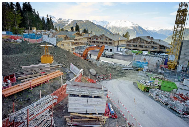
Другая сторона швейцарских Альп (hebdo.ch)