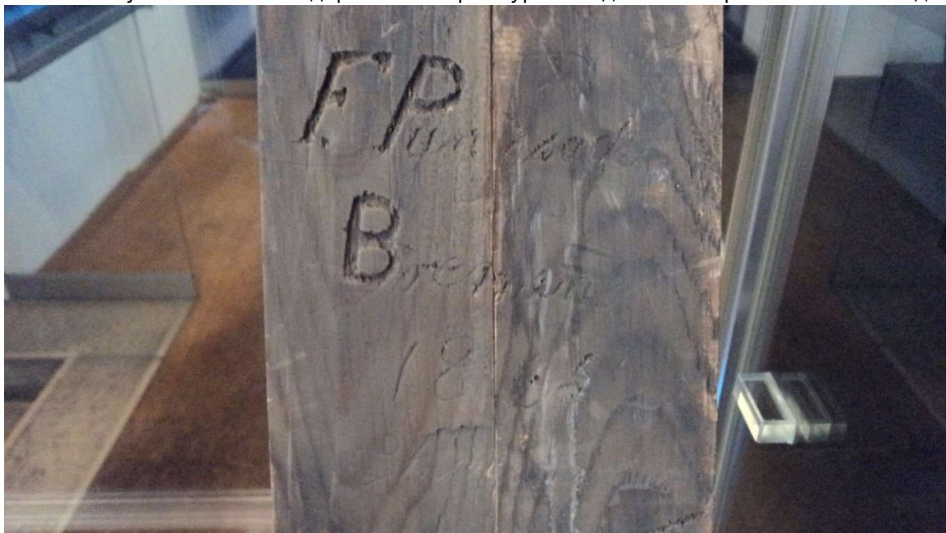
Фрагмент арматуры одного из куполов с автографами строителей, 1865 г.