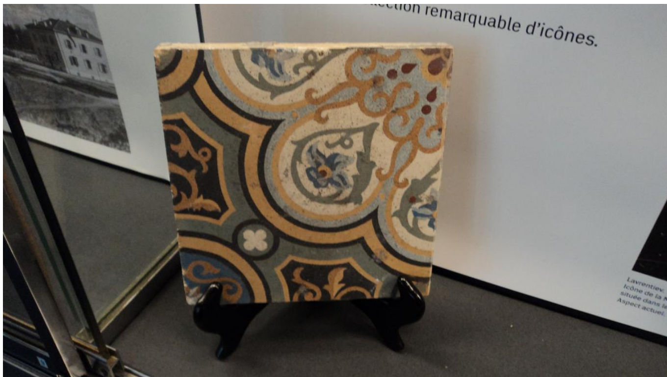
Оригинальная напольная плитка 1894 г.

Во-первых, это история храма и русского православия вообще в контексте истории города и кантона Женева: как получилось, что храм был построен в «протестантском Риме» и какие связи у него были и есть с Женевой и со Швейцарией за прошедшие полтора века, на протяжении которых православные из России и других стран никогда не оставались в Женеве замкнутыми в своем отдельном мирке? Становится ясным, почему совпали интересы женевских политиков и русских православных середины XIX века, что и привело к появлению русского храма на останках крепостных стен старого города.