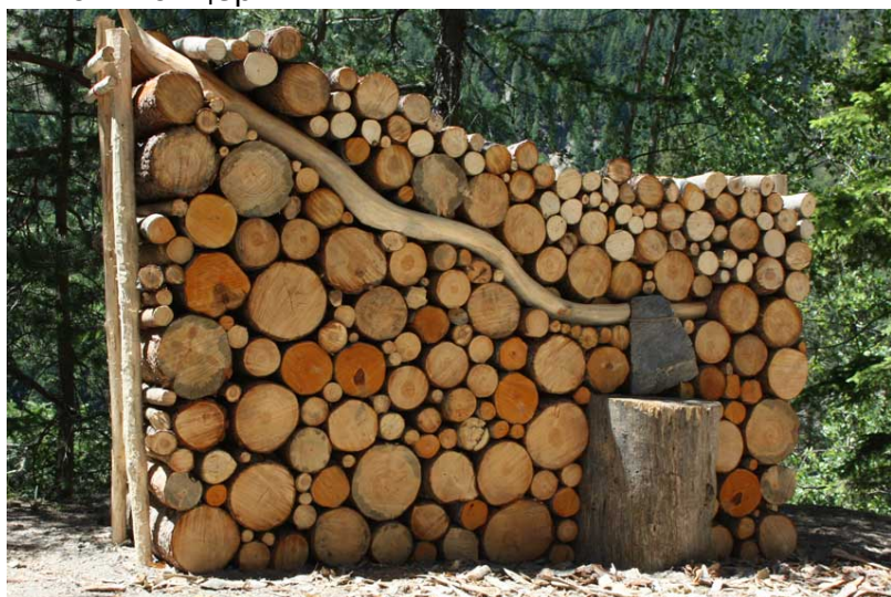
Лэнд-арт в Невшателе (jbneuchatel.ch)

В музее Ритберг в Цюрихе до 9 октября проходит выставка «Сады мира» , посетители которой узнают много интересного об истории садового искусства разных цивилизаций и эпох. В парке Rieterpark, где находится музей, воссозданы цветочные клумбы в том виде, в каком они радовали глаз в XIX веке. Также параллельно выставке предусмотрены творческие занятия, рынок пряностей, вечера кино и концерты.