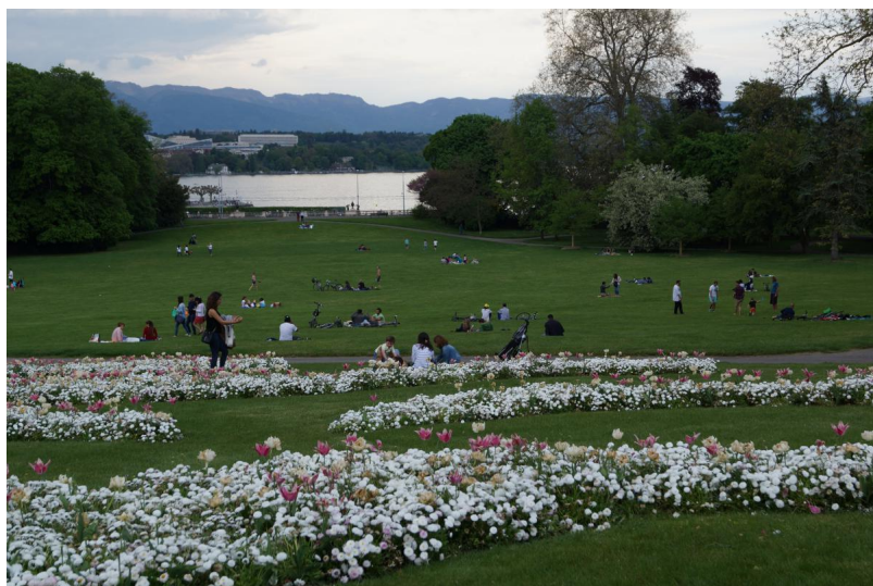
Женевцы, этот город принадлежит вам!

Отсюда вытекает основная цель «Года садов 2016» : в рамках выставок, экскурсий, круглых столов, а также с помощью публикаций начать всесторонний междисциплинарный диалог с участием населения, экспертов по окружающей среде и городскому планированию, журналистов и представителей власти всех уровней. Диалог касается социальной и культурной роли зеленых пространств в растущих и уплотняющихся городах.