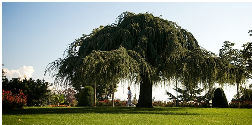
Все на охоту! За красивыми деревьями (lausanne.ch)

В ботаническом саду Невшателя до 8 октября проходит бесплатная выставка работ художников, создающих свои произведения в жанре лэнд-арт . Параллельно выставке в саду пройдет ряд мероприятий, связанных с темой лэнд-арта, первоначально возникшего, как протест против искусственности и коммерциализации художественных произведений в США в конце 1960-х годов. Здесь же, в ботаническом саду, до 15 октября 2017 проходит бесплатная выставка «Земля инструментов» , рассказывающая длинную историю, которая связывает людей с растениями, дающими пищу, строительные материалы и лекарственные средства. В рамках выставки пройдут мероприятия и конференции, которые помогут лучше понять развитие технических приемов и познакомиться с исчезнувшими профессиями. Часть инструментов посетителям предстоит опробовать в действии и попытаться угадать, что у них в руках.