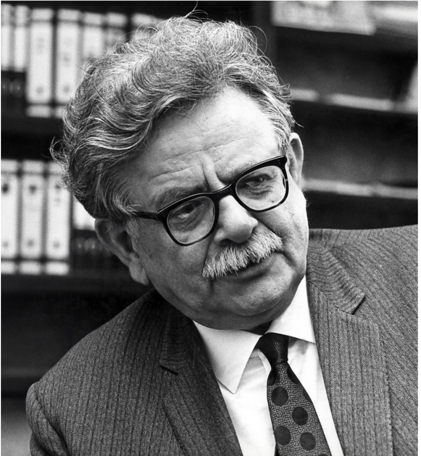
Элиас Канетти (1905 - 1995)

одного интервью, даже после получения Нобелевки!