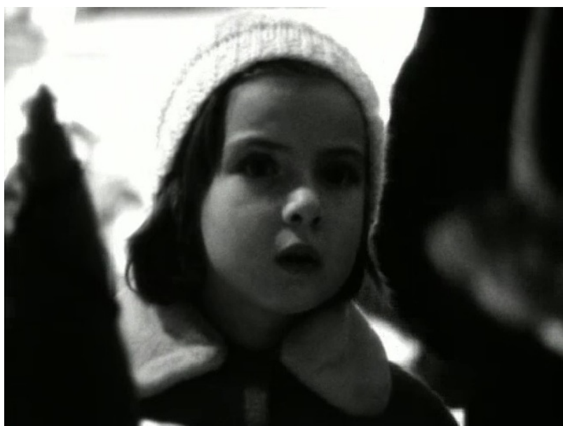
У витрины магазина игрушек

В 1966 году подарками для детей становились юлы (внутри некоторых помещались лошадки, которые «бегали» по кругу, стоило запустить юлу по полу), жестяные разукрашенные полицейские машины, заводные вертолеты (предтечи сегодняшних дронов?) и – верх шика – электрические роботы.