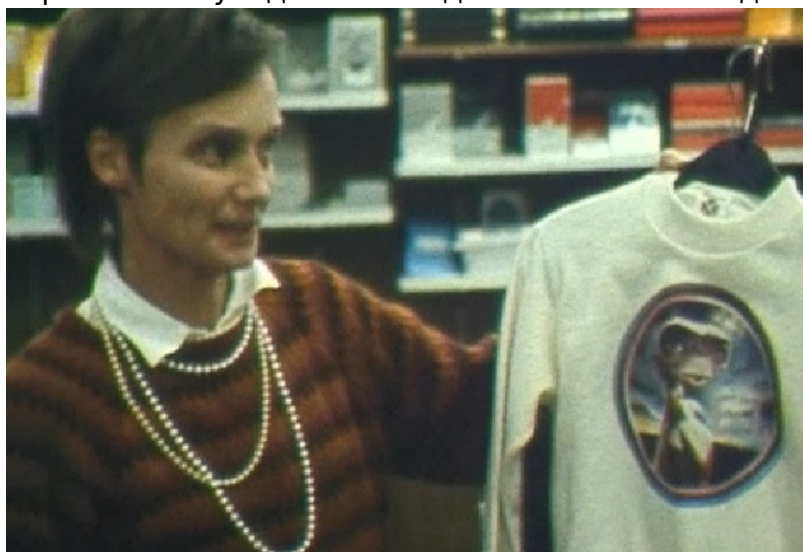
Футболка с изображением инопланетянина

А как «рождаются» куклы? Мягкую голову насаживают на стержень и вращают под машиной, обшивающей голову волосами. Затем в глазницы вставляют глаза, рисуют черты лица, причесывают и покрывают лаком волосы. Кукол, которые ходят, разговаривают и поют, тоже проверяют... если представить себе, что приходится слушать их тонкие голоса каждый день, из года в год, можно понять, каким терпением и усидчивостью должны были обладать работницы-кукольницы.