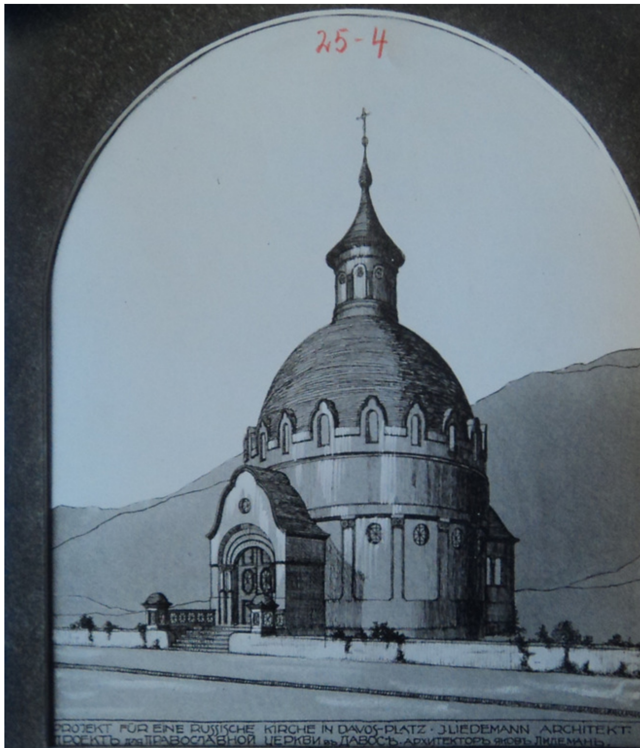
Эскиз Православной церкви в Давосе. Вариант В.