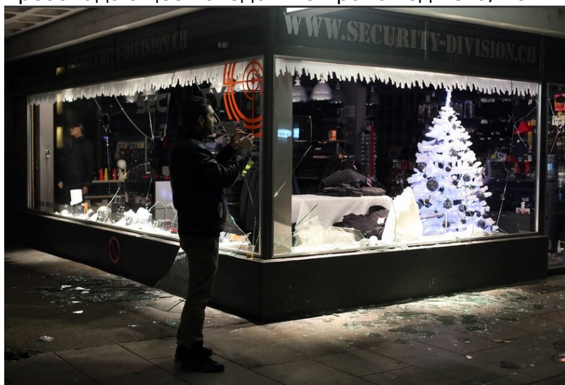
Одна из разбитых витрин

Тем временем Гражданское движение Женевы (MCG) и Швейцарская народная партия (UDC) опубликовали совместное коммюнике, в котором высказали требование создать следственную парламентскую комиссию (СЕР), чтобы пролить свет на то, каким образом демонстрация в ночь с 19 на 20 декабря переросла в уличные беспорядки. MCG и UDC осуждают неудовлетворительную работу полиции, в частности – ее пассивность, а также то, что за прошедшие дни она никого не задержала. В коммюнике подчеркивается, что «чувство небезопасности, преобладающее вследствие происшедшего, невыносимо в правовом государстве».