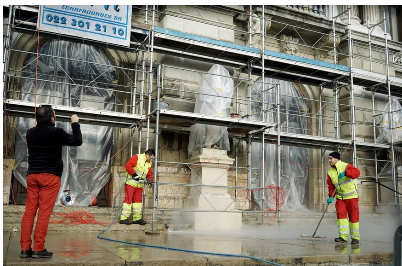
Работа над фасадом Большого театра (tdg.ch)

Демонстрация «выросла» из несанкционированного собрания, о проведении которого было объявлено за неделю до происшедшего на сайте под названием Renversé, созданном с целью защиты альтернативной культуры. О создателях сайта пока ничего не известно, а женеvские движения альтернативной культуры отрицают свою причастность, осуждая действия вандалов.