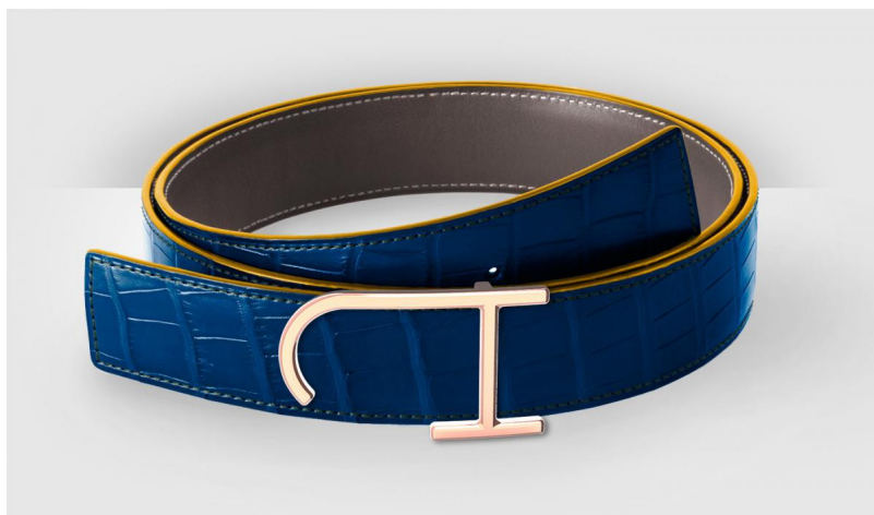
Изделия из кожи

Чтобы рассказать историю еще одной молодой компании, нужно вернуться в Париж 1925-1965 годов. В это время здесь работали мастерские сафьянщика Жана Опенстана, производившие, среди прочего, удобные дамские сумки. Выйдя на пенсию и закрыв производство, удачливый предприниматель устроился на берегу Лемана.