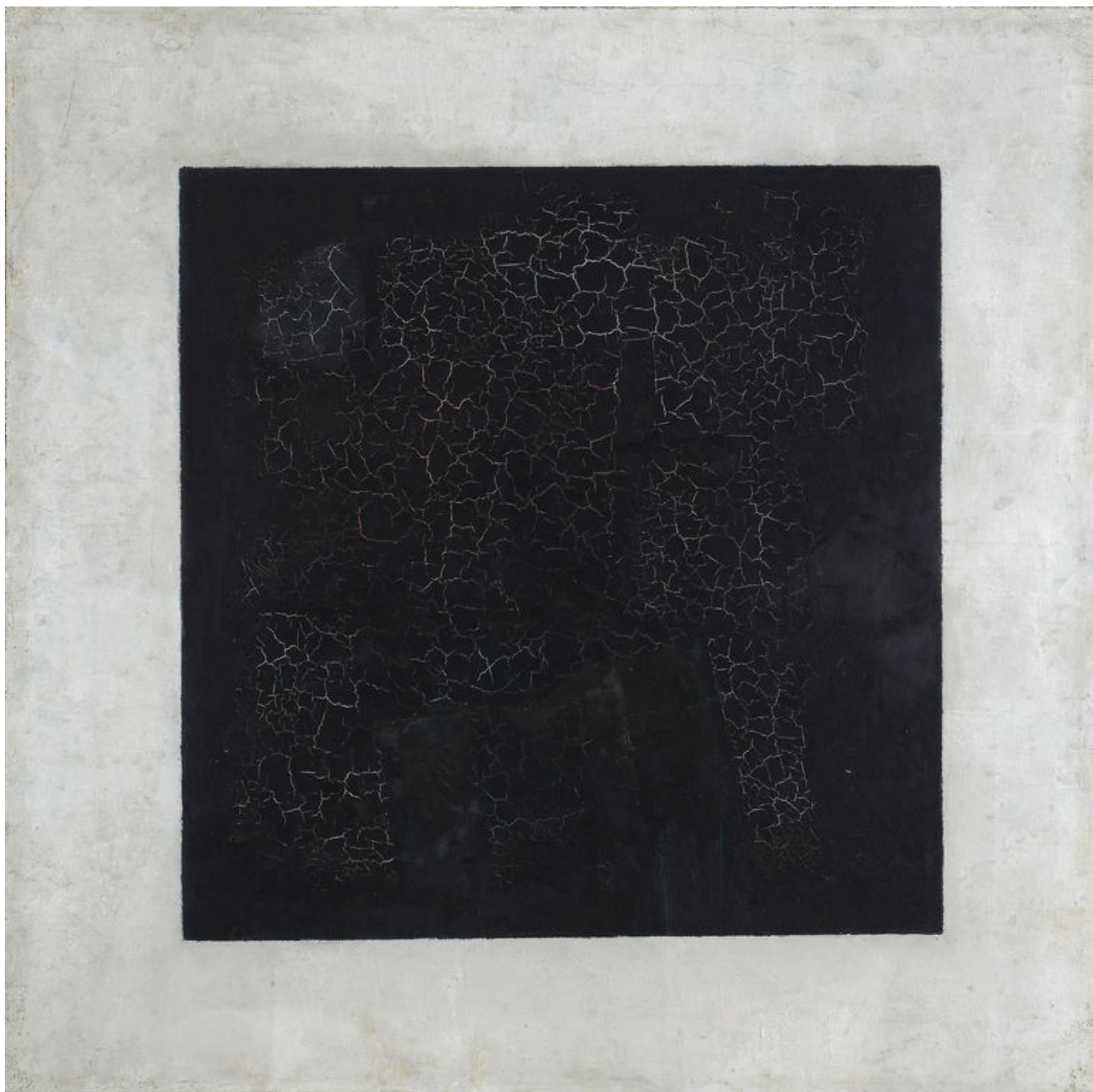
Казимир Малевич «Черный квадрат», 1929 г. Холст, масло, 79,2 x 79,5.