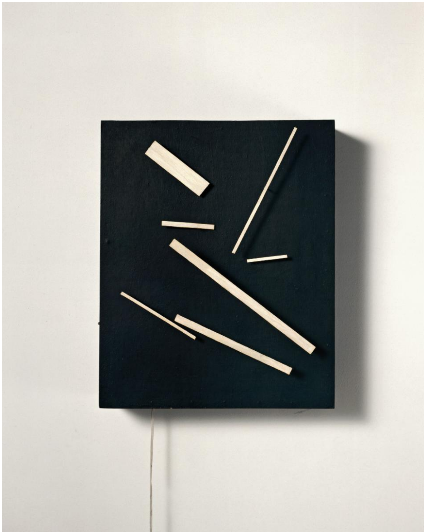
Жан Тэнгли. "Мета-Малевич", мета-механический рельеф, 1954 г. 61 x 50 x 20 см (с) Museum Tinguely, Basel

... «Эти супрематисты никого не вдохновили ни своими речами, ни своими картинами. Публика просто весело смеялась», – писали петроградские «Биржевые ведомости» 10 января 1916 года. А у вас до 10 января 2016-го есть возможность составить