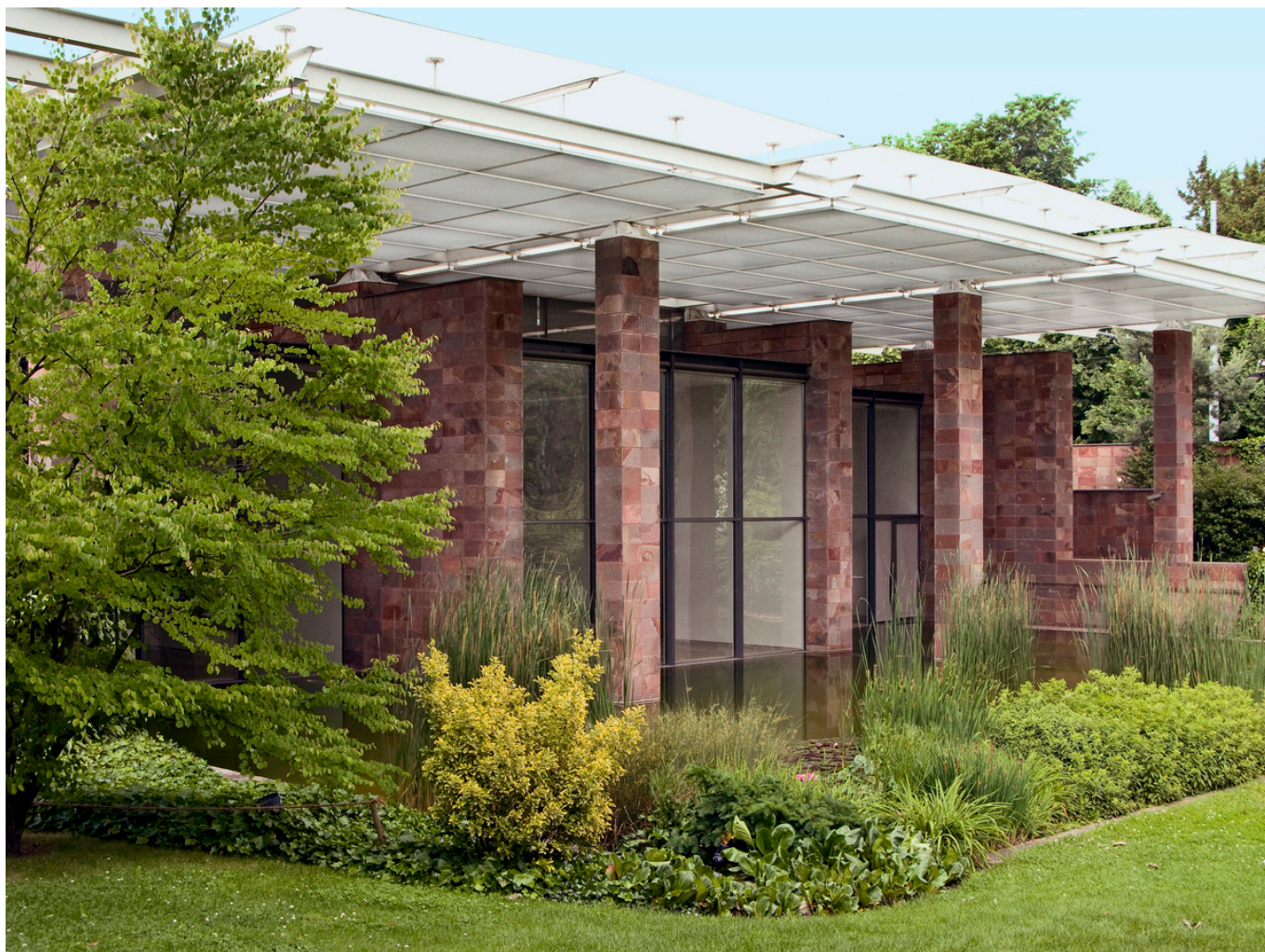
Фонд Бейлера в Базеле

Auteur: Надежда Сикорская, Базель , 01.10.2015.