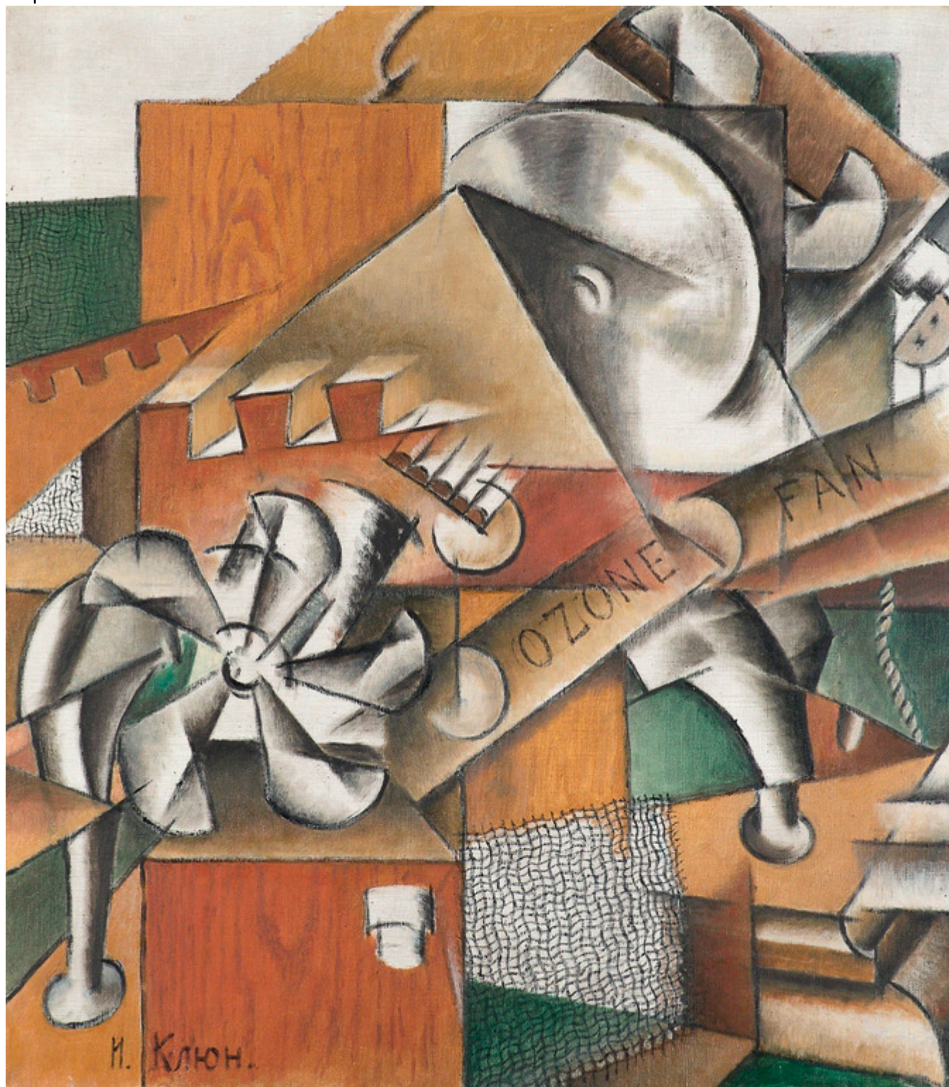
Иван Ключ. «Озонатор», 1914 г. Холст, масло, 75х66 см., (с) Государственный Русский музей, Санкт-Петербург

пятен». Из 154 (или 155?) работ, представленных в декабре 1915 года на выставке в Петрограде, уцелела только треть, да две фотографии экспозиции, афиши и несколько экземпляров не иллюстрированного каталога. Эти произведения искусства и документы были впервые вновь собраны воедино в Базеле в результате многолетних поисков по музеям, архивам и частным коллекциям. Помимо московской Третьяковской галереи, петербургского Русского музея и еще четырнадцати российских музеев, редкие и ценные творения из своих собраний одолжили Фонду Бейлера Центр Помпиду в Париже, Городской музей Амстердама, Музей Людвига в Кельне, Коллекция Георгия Костакиса в Салониках, Институт искусств Чикаго и нью-йоркский MOMA.