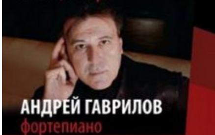
АНДРЕЙ ГАВРИЛОВ фортепиано