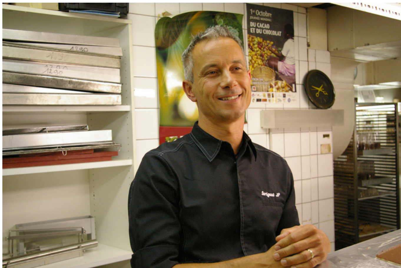
Мэтр Серина

Весь коллектив Du Rhône (включая работников кафе) состоит из 8 человек, при этом в небольшом помещении для хранения готовой продукции практически пусто. Объясняется это просто: в шоколад ручной работы не добавляют консерванты, а значит, заготавливать его впрок не имеет смысла. Все, что производится на третьем этаже, тут же отправляется вниз, в кафе, или в Лондон, а то и дальше – в Тайбэй (Тайвань) и Эр-Рияд (Саудовская Аравия), где в начале этого года открылись такие же кондитерские.