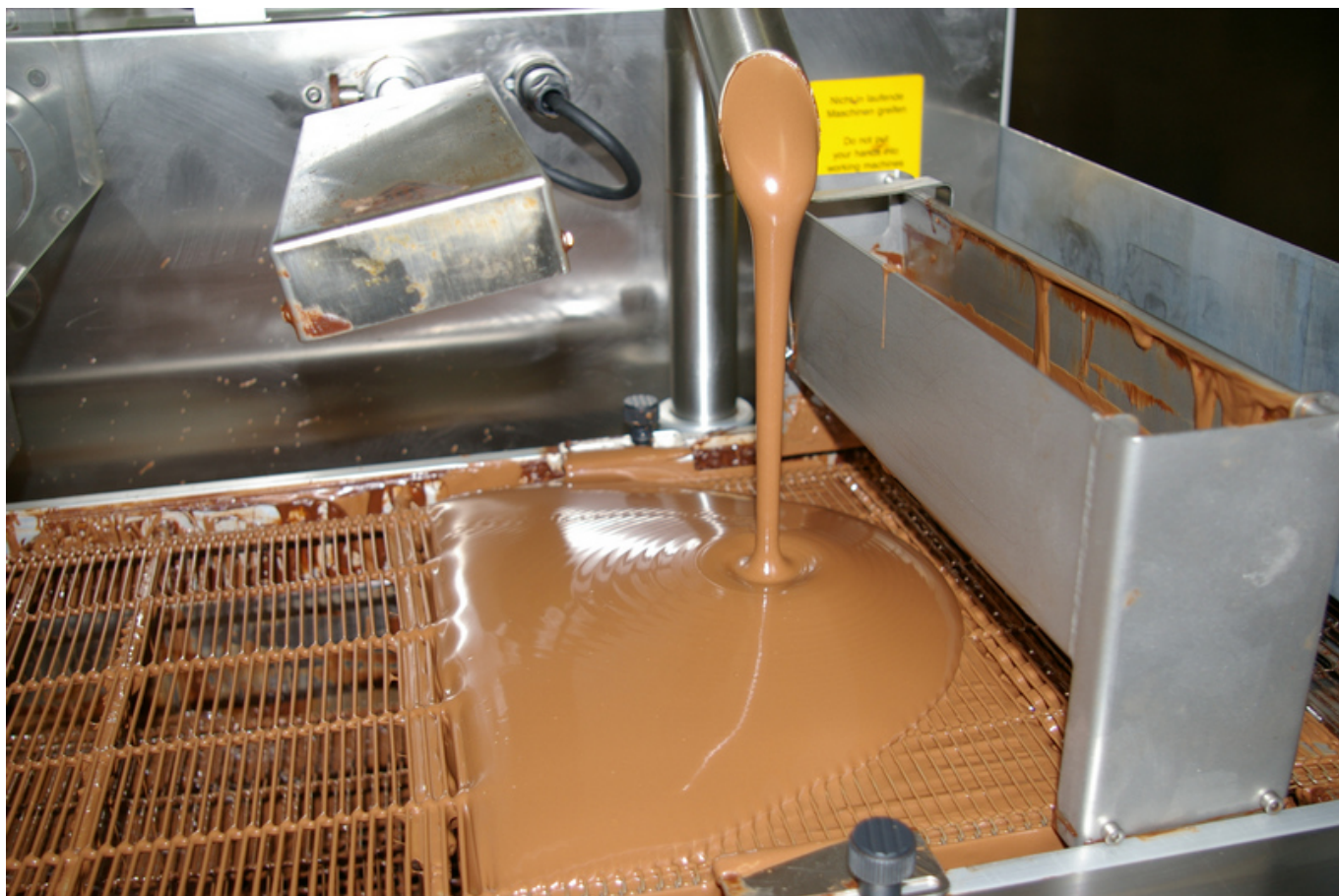
Аппарат для нанесения шоколадного слоя

«Мы обсуждали такую возможность с российскими партнерами, интерес к сотрудничеству проявили две торговые сети. Но сейчас сложилась сложная экономическая ситуация, в том числе из-за проблем с курсом валют. Теперь нашим потенциальным контрагентам сложнее закупать у нас продукцию. Так что наши отношения пока находятся в режиме stand-by из-за кризиса, экономической и политической ситуации. При том, что мы были готовы работать в ноль, только чтобы покрыть наши расходы и иметь возможность выйти на рынок», – сказал Федерико Марангони, добавив, что, на его взгляд, постсоветский рынок не самый простой для начала работы.