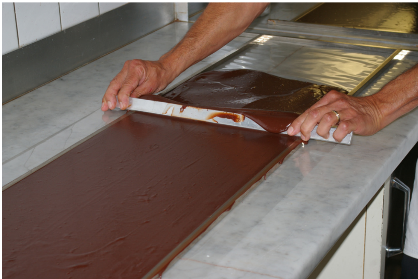
Обработка шоколада

В планах владельцев Du Rhône – покорение Китая, где к концу года откроются бутики в Шанхае и Пекине, и США, где швейцарский шоколад будет представлен в некоторых магазинах Нью-Йорка, Бостона и других городов. Еще одно направление, к которому проявляют интерес женеvцы – Индия. Однако на этот рынок, откуда пришлось уйти даже такому гиганту, как Lindt, очень трудно попасть, ввиду серьезных таможенных, санитарных и других ограничений. А что же страны постсоветского пространства?