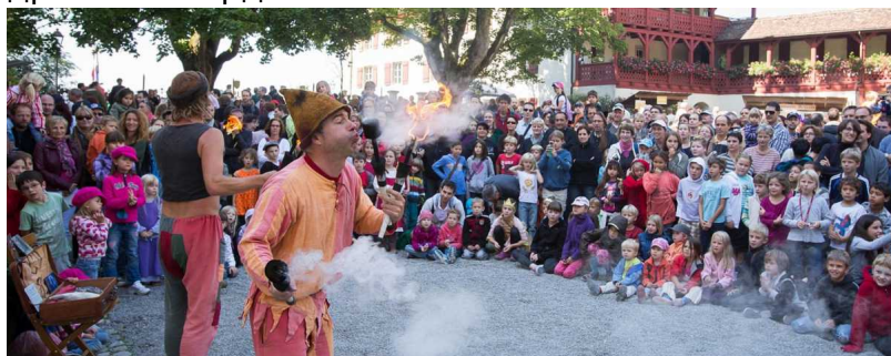
Развлечения для больших и маленьких в замке Ленцбург

Замок Ленцбург – наверное, один из самых старинных в Швейцарии. Его древние башни возвышаются в кантоне Аргау. Со времен позднего Средневековья замком владели поочередно графы Ленцберг, Кибург, Габсбурги, бернские бальи, богатые американские семьи. Сегодня здесь располагается исторический музей и, благодаря богатству экспозиций, представляет собой настоящий рай для любителей древностей – на каждом этаже посетителей ждут новые находки. В подвалах сохранилась средневековая тюрьма, а в верхних этажах расположились тематические выставки, посвященные эпохе рыцарства, Средневековья, Ренессанса, барокко. Найдутся тут развлечения и для детей: в специально обустроенном музее их ждет дракончик Фаухи. Кто из малышей не мечтал стать хоть на время прекрасной принцессой или бесстрашным витязем? В замке Ленцбург самые маленькие посетители смогут своими руками смастерить себе одеяние и, облачившись в старинный наряд, отправиться исследовать потаенные уголки этой древней твердыни.