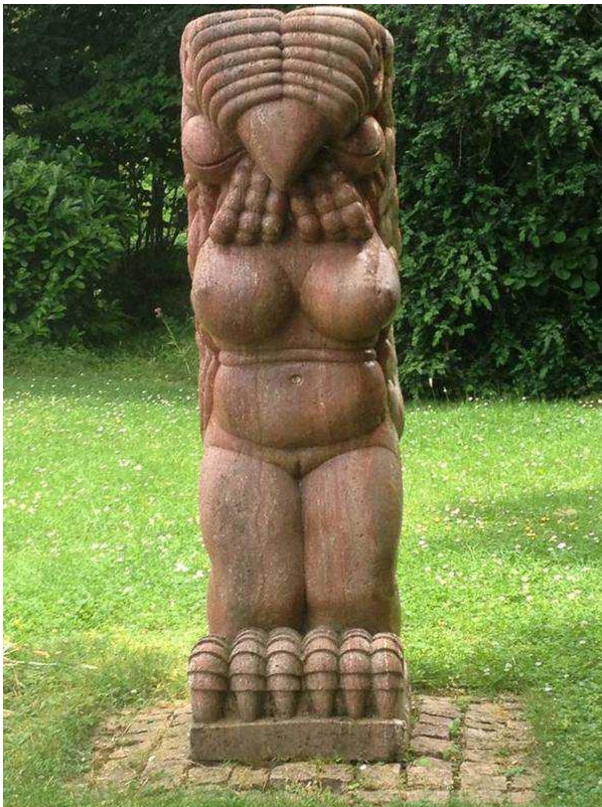
Церера с головой птицы. Автор - Даниэль Полиан (© N. Beglova/Nashagazeta.ch)

Не так давно на скульптуре все-таки появилась табличка с надписью: «Церера с головой птицы», Даниэль Полиан, 1979 г. (Cérès à tête d'oiseau, Daniel Polliand). Обычно Церера, древнегреческая богиня плодородия, изображается красивой женщиной с корзиной с плодами в руках. Но кто видел живую Цереру? Никто. А потому скульптор вполне имел право на творческую фантазию. Зато увидев однажды его Цереру, вы вряд ли ее забудете – она уж точно привлекательнее, чем какая-нибудь девушка с веслом или метательница диска, которыми так любили украшать