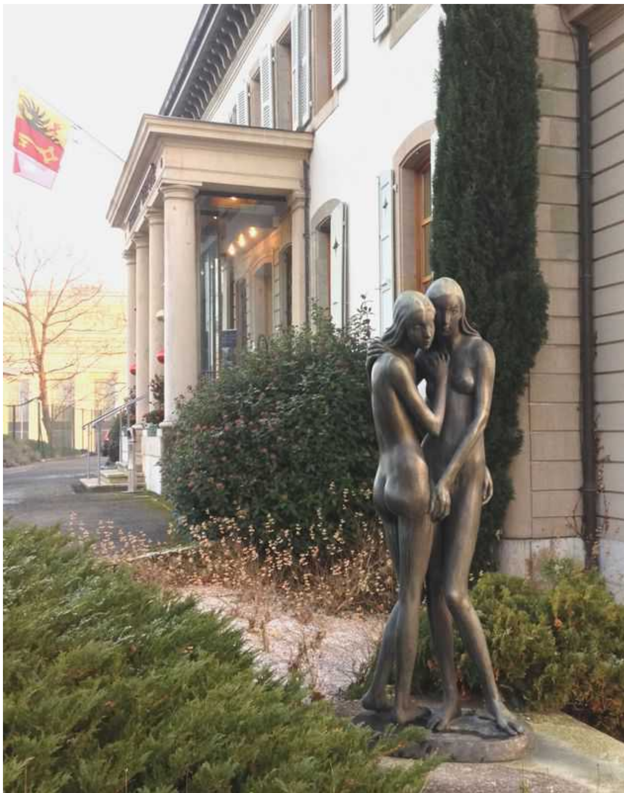
Скульптурная группа во дворе ресторана Vieux-Bois

Завсегда и ресторана окрестили скульптуру памятником нетрадиционной любви, и это прозвище заменило официальное название в наш век политической корректности.