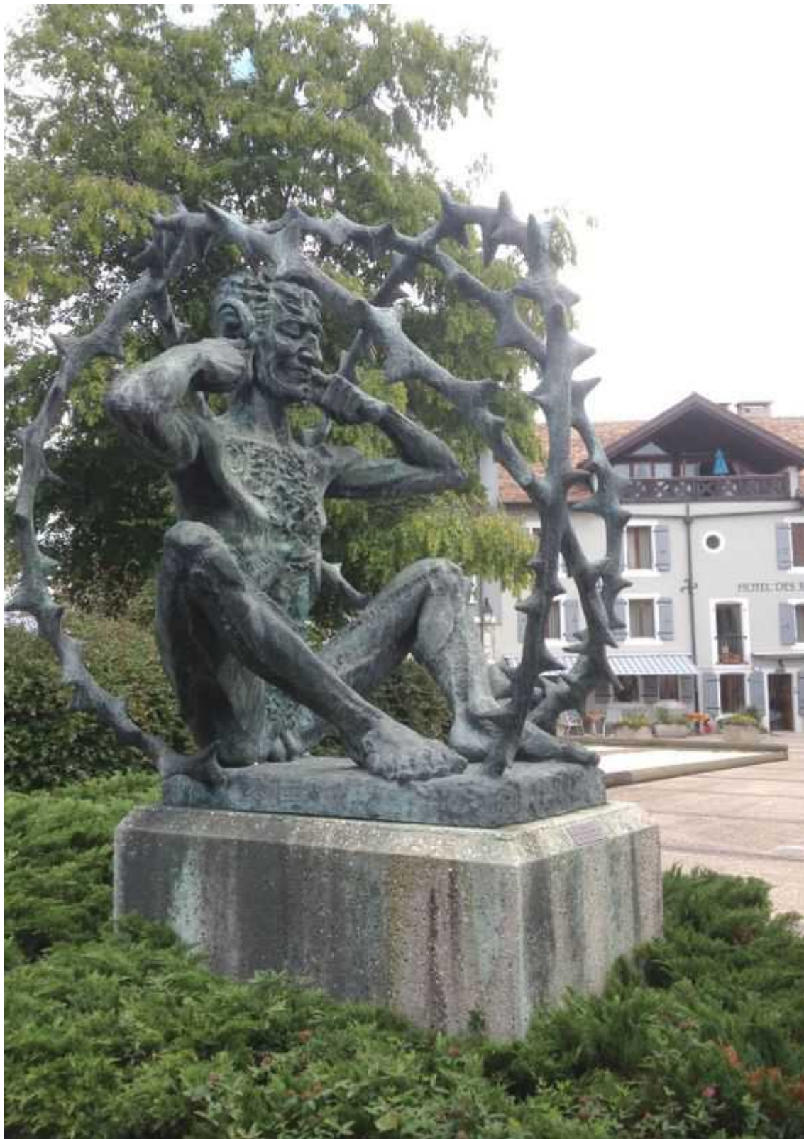
Долой шум!