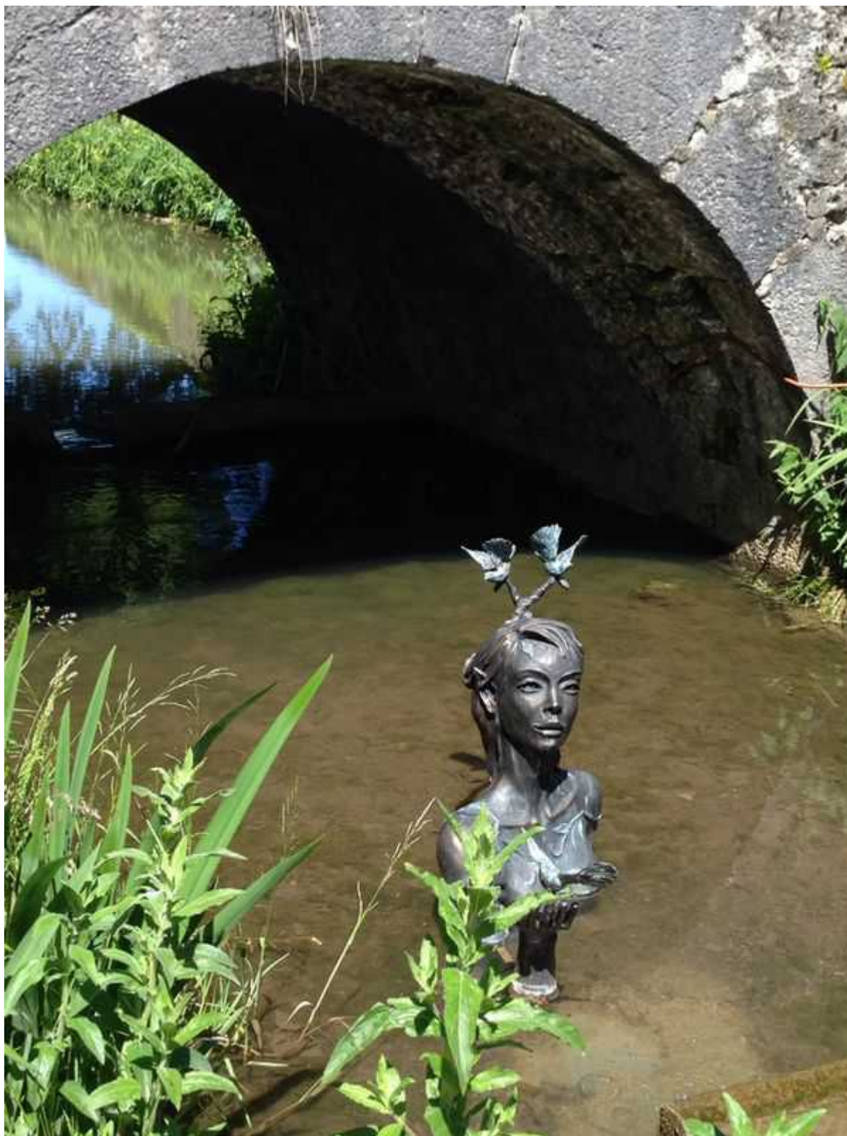
Русалка - Алиса в Вюльрансе

Конечно, мы рассказали далеко не обо всех скульптурах - странных, чудаковатых, забавных, страшеньких и оригинальных, - которые можно увидеть на улицах Женевы и других городов Швейцарии. Их много, не все они равнозначны по своим художественным ценностям. Кстати, их ряд чуть было не пополнился - наш плодовитый Зураб Церетели пытался и Женеве подарить одно из своих произведений, но что-то там сорвалось.